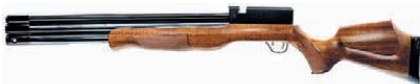
Будущий бестселлер «слонобойного» калибра 12,7 мм – РСР-винтовка Single Shot .50" Dragon

РСР-пневматики могут превратиться в практический опыт. Тем более, что VAM50 сертифицирован как «не оружие» и продаётся без лицензии. У дотошных читателей сразу же возникнет вопрос о дульной энергии... Я поостерегусь говорить об абсолютных цифрах. Ни для кого не секрет, что конструкция практически всех РСР-образцов позволяет экспериментировать с начальной скоростью пули в очень и очень широком диапазоне, и VAM50 не исключение. Причём при относительной сложности устройства, имея необходимые технические знания, внимание