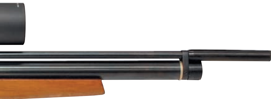
Однозарядная РСР-винтовка VAM50 калибра 4,5 мм. Продаётся без разрешений и лицензий. Планируемая цена $ 400-450

никаких сомнений в работоспособности механизмов нет, но сразу возникают вопросы по долговечности некоторых уплотнений и наличие возможность улучшить характер взаимодействия ударника с шепталом (полировка). Но всё это мелочи, к которым можно и нужно относиться философски. Согласитесь, что $ 400 по сравнению с ценой в $ 2000, делают РСР-винтовку доступной для, мягко говоря, существенно более широкой аудитории, чем раньше. Теперь у огромной массы любителей пневматики появилась практическая возможность приобрести то, о чём они долго мечтали – теоретические размышления о достоинствах