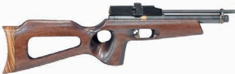
РСР-карабин Falcon FM 8 WJR не имеет аналогов на российском рынке и по сути представляет из себя пистолет с 8-дюймовым стволом и коротким прикладом