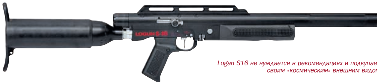
Logan S16 не нуждается в рекомендациях и подкупает своим «космическим» внешним видом