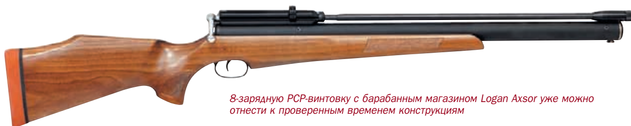
8-зарядную РСР-винтовку с барабанным магазином Logan Axsor уже можно отнести к проверенным временем конструкциям

никаких сомнений в работоспособности механизмов нет, но сразу возникают вопросы по долговечности некоторых уплотнений и наличие возможность улучшить характер взаимодействия ударника с шепталом (полировка). Но всё это мелочи, к которым можно и нужно относиться философски. Согласитесь, что $ 400 по сравнению с ценой в $ 2000, делают РСР-винтовку доступной для, мягко говоря, существенно более широкой аудитории, чем раньше. Теперь у огромной массы любителей пневматики появилась практическая возможность приобрести то, о чём они долго мечтали – теоретические размышления о достоинствах