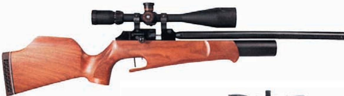
Даже внешне винтовки английской фирмы Theoben Ltd. выглядят довольно оригинально. Скоро их можно будет оценить практически