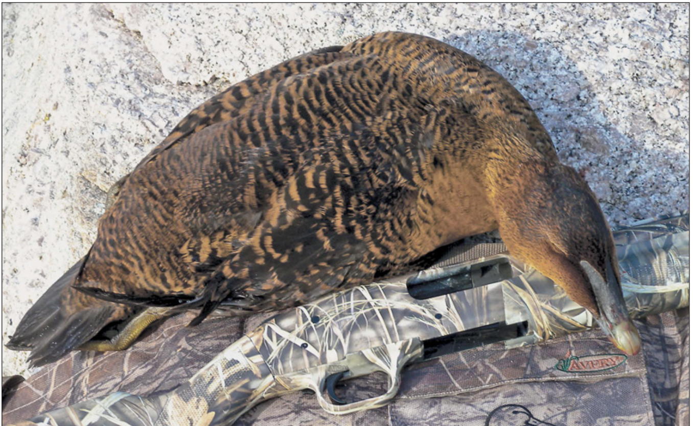
Год охоты на пернатых запомнился автору различными приключениями, от походов на гусей в Аргентине до охоты на куропаток в Вайоминге

мифическому Анкею-аргонавту обломилось выпить вина, хотя он уже поднёс кубок к губам, так и мне обломилась моя поездка. Правда, не от клыков дикого кабана, как бедолаге Анкею – я поскользнулся на льду. В результате порванная связка четырёхглавой мышцы, хирургическая операция, реабилитация и огромное разочарование были обеспечены. Короче, всё по мудрой пословице: «Человек предполагает, а Бог – располагает». После выздоровления я просто оказался не способен полностью отдаться душой и сердцем чему-нибудь, связанному с охотой на крупную дичь, не будучи уверенным в том, что моя нога меня не подведёт. Прежде чем мне