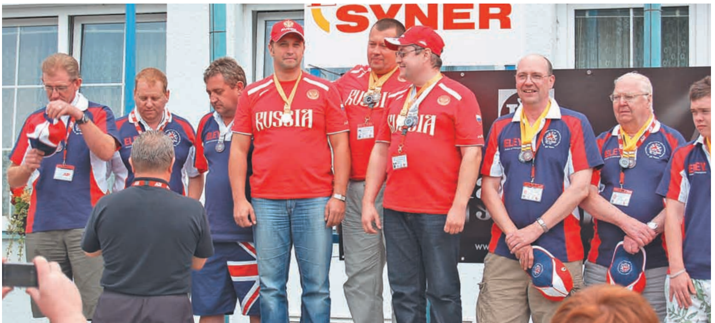
Награждение команд, победивших в классе NVA. Первое место завоевала сборная России

P.S. Всю информацию по российским и международным соревнованиям можно будет найти на сайте www.air-benchrest.ru