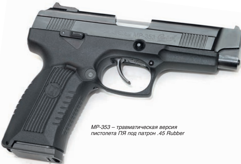
MP-353 – травматическая версия пистолета ПЯ под патрон .45 Rubber

и исключением, пожалуй, являются бенчрест и отдельные снайперские задачи. А вот для заметного удешевления главного расходника стрелка – патронов, без переснаряжения не обойтись. В этом смысле не могут не радовать шаги Казанского казённого порохового завода на пути удовлетворения потребностей россиян в порохах различных сортов. Казанцы выпустили пороха «Сунар» для снаряжения патронов калибров .308 Win., .223 Rem. и .30-06 Spr. в розничной упаковке. Сотрудница завода на стенде в Гостином дворе сообщила мне, что эти пороха оружейные магазины покупают, одновременно посетовав, что заказов маловато.