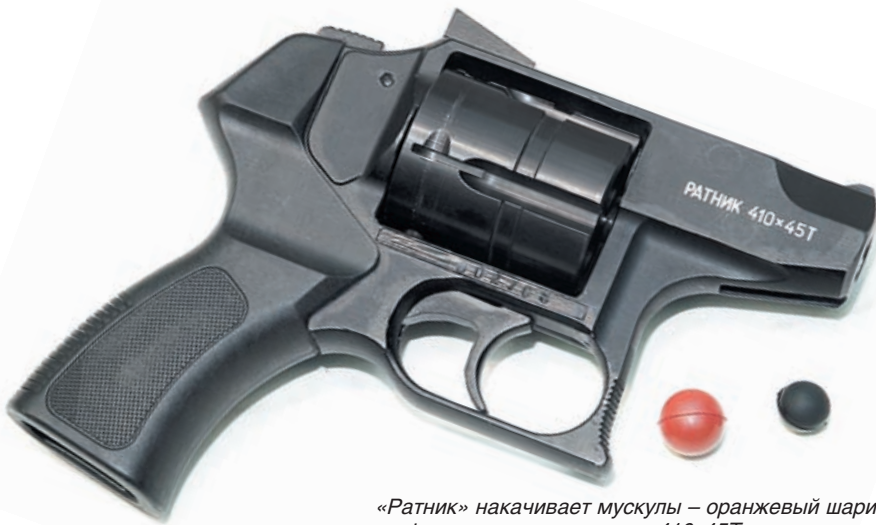
«Ратник» накачивает мускулы – оранжевый шарик на фото из нового патрона .410x45T