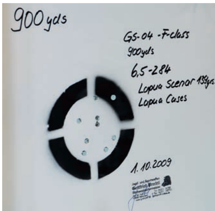
Prechtl действительно умеет делать оружие со столь выдающейся кучностью на больших дистанциях