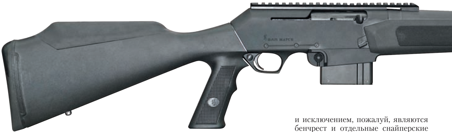
Эффективный внешний вид самозарядного карабина Browning BAR Match наверняка позволит не залежаться новинке на оружейных прилавках