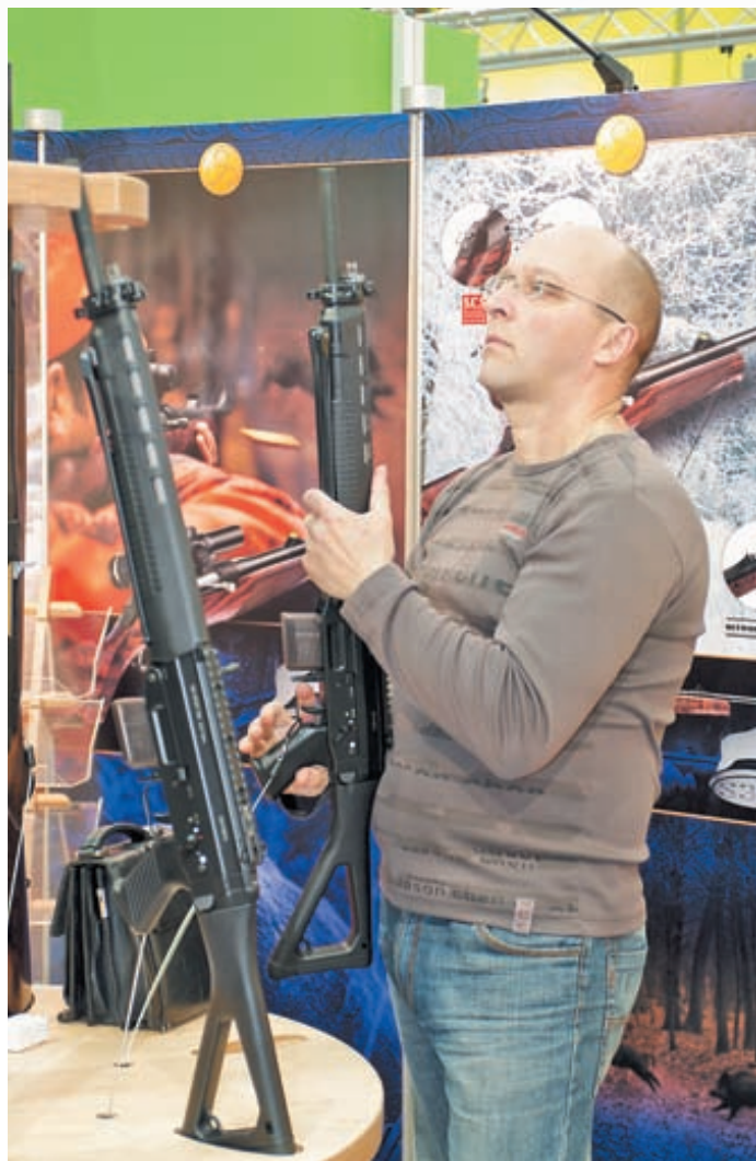
SIG Sport 550 на выставке ни на минуту не оставался без внимания