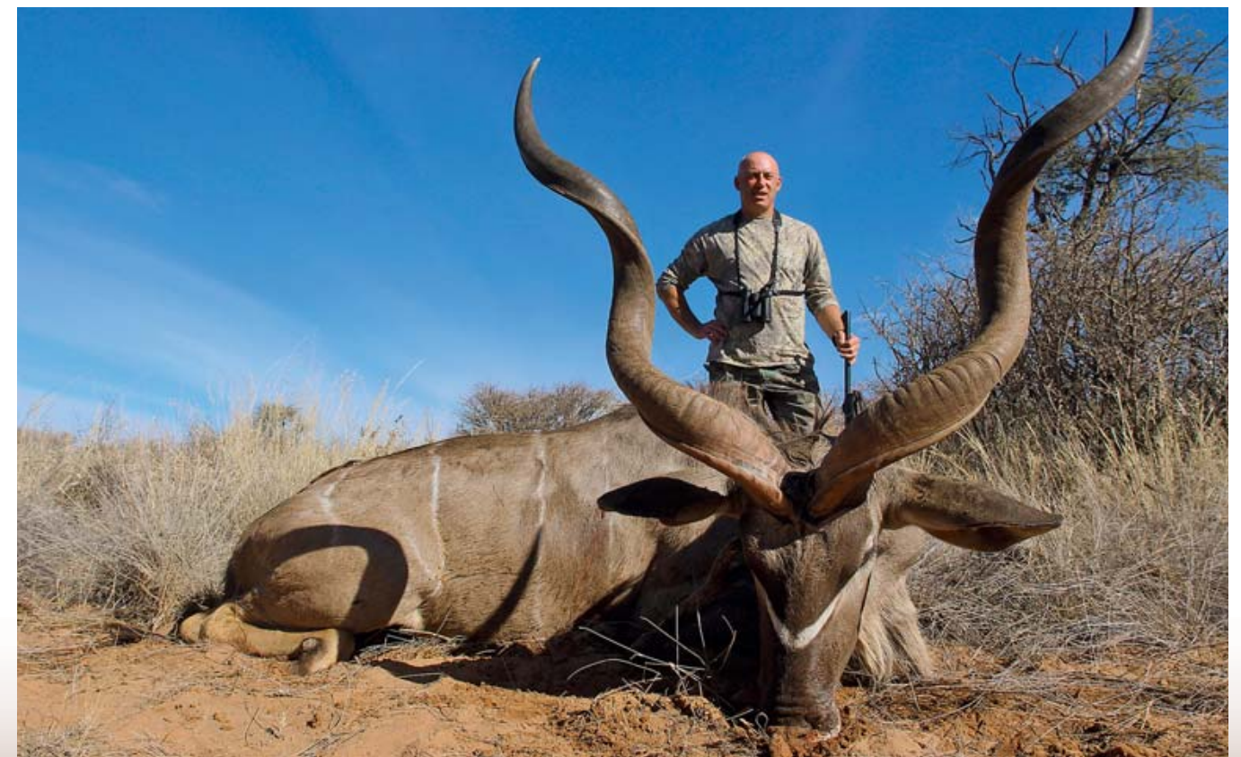
Этого куду я добыл скорее по привычке и в силу уважения к принимающей стороне, нежели из-за его трофейных качеств