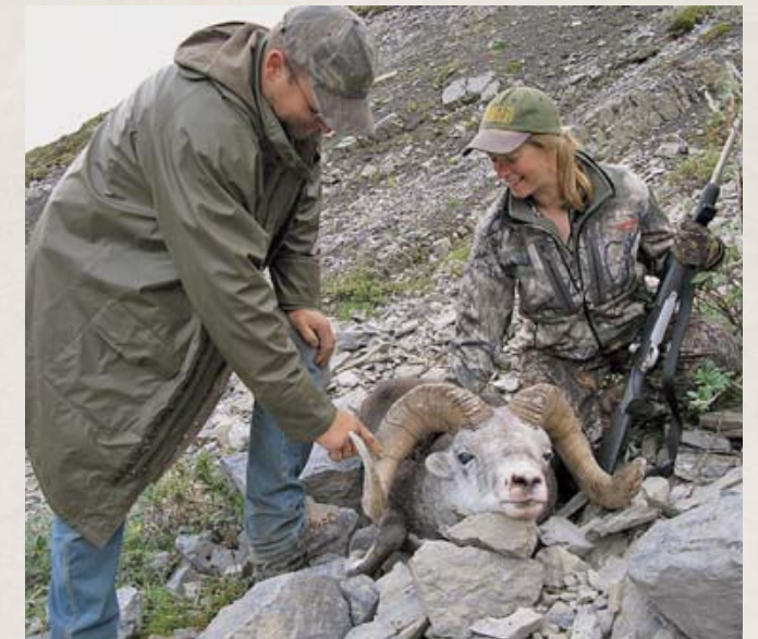
Правильный выбор аутфиттера – это первый шаг к тому, чтобы заполучить желанную вам охоту

Внимательно рассматривайте оператора, являющегося членом местной ассоциации