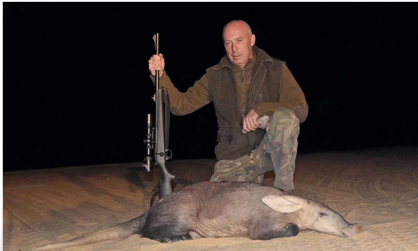
Аардварка-трубкозуба я хотел заполучить в свою коллекцию вот уже восемь лет! Но реализовалась мечта лишь в Намибии этим летом. Чем не удача?!