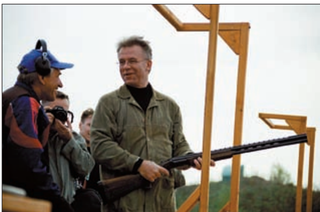
Председатель Госкомспорта РФ Вячеслав Фетисов быстро нашёл общий язык со стрелками – ружьё он держит в руках не впервые