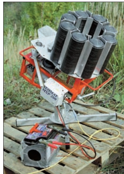
На 12-и площадках «Лисьей норы» установлено более 60-и металательных машин половина из которых – шведской фирмы «Беомат»