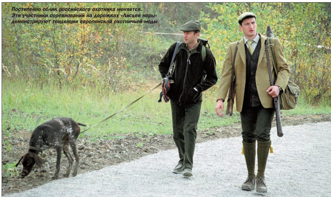
Постепенно облик российского охотника меняется. Эти участники соревнований на дорожках «Лисьей норы» демонстрируют тенденции европейской охотничьей моды