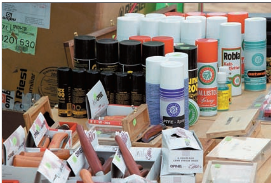
В павильоне компании «Лазер-трейдинг» стрелки могли приобрести средства для ухода за оружием фирмы «Балистол-Клевер» и знаменитые складные ножи «Опинель» по специальной цене

должны были отстрелять 150 мишеней, проходя каждый день по три маршрута с 12-ю стрелковыми площадками.