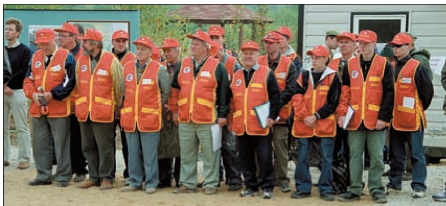
«Спецодежду» судейского корпуса соревнований изготовила производственная фирма «Росхантер»

Т ерритория «Лисьей норы» находится в живописнейшем месте с естественным ландшафтом, великолепно подходящим для проведения соревнований по большому спортивному. В перспективе «Лисья нора» превратится в оборудованный в соответствии со всеми современными требованиями стрелковый комплекс, где будет возможно проведение соревнований по всем олимпийским видам стрельбы из гладкоствольного ружья, малокалиберного пистолета и винтовки, а также пневматики. Насколько быстро планы