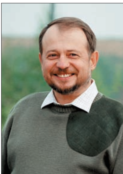
Президент Национальной федерации спортивного стрелкового спорта Владимир Лисин