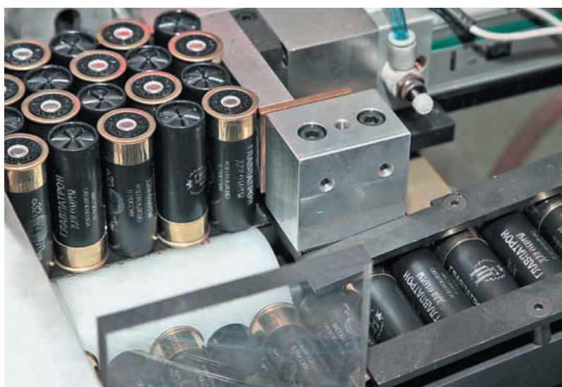
За укладку в фирменные коробки на «Патронной мануфактуре» также отвечает автоматика, формируя из готовых патронов аккуратные блоки по 10 или 25 штук