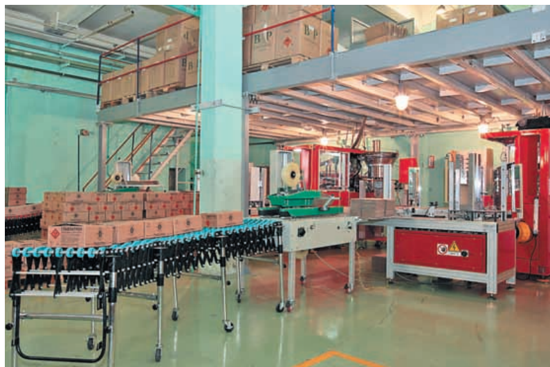
Сборочное производство «Патронной мануфактуры» оснащено по последнему слову техники