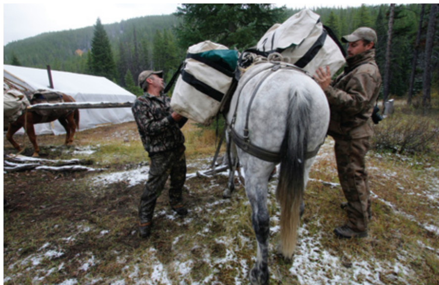
Всё, что вы хотите привезти с собой или увезти из похода, будет транспортироваться на крепких спинах лошадей и мулов.

«Попробуйте послать сигнал гона. Это всегда заставляет их бежать».