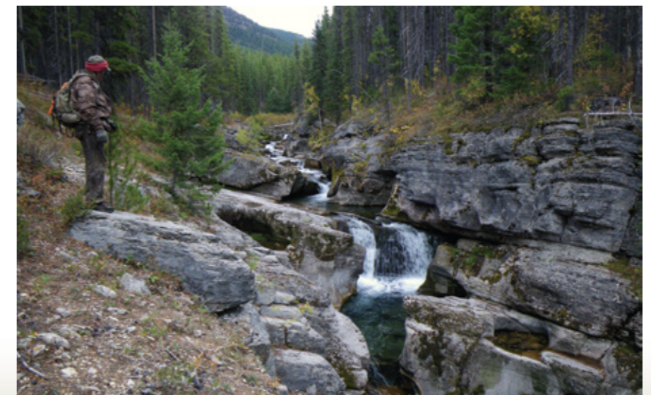
Красота природы Монтаны в сентябре не имеет себе равных.