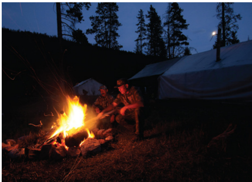
Пышущий огнём лагерный костер – это прекрасное место, где можно вновь пережить события дня прохладной осенней ночью.

Мы шли по оленьим тропам через ивовые заросли, пробираясь среди поваленных деревьев, потом стали взбираться по крутому склону. Снег быстро перекрашивал ивы в белый цвет и скрывал сучки елей. Мы слышали,