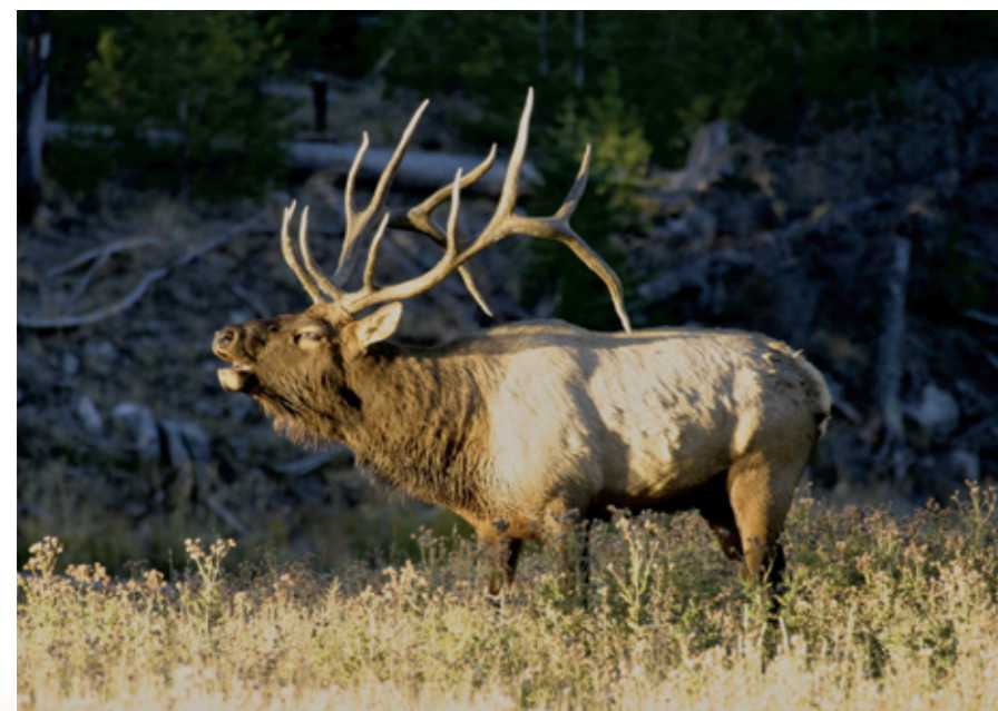
Рёва огромного быка бхб, доносящегося из-за высоких деревьев, достаточно для того, чтобы заставить учащённо биться сердце любого охотника.