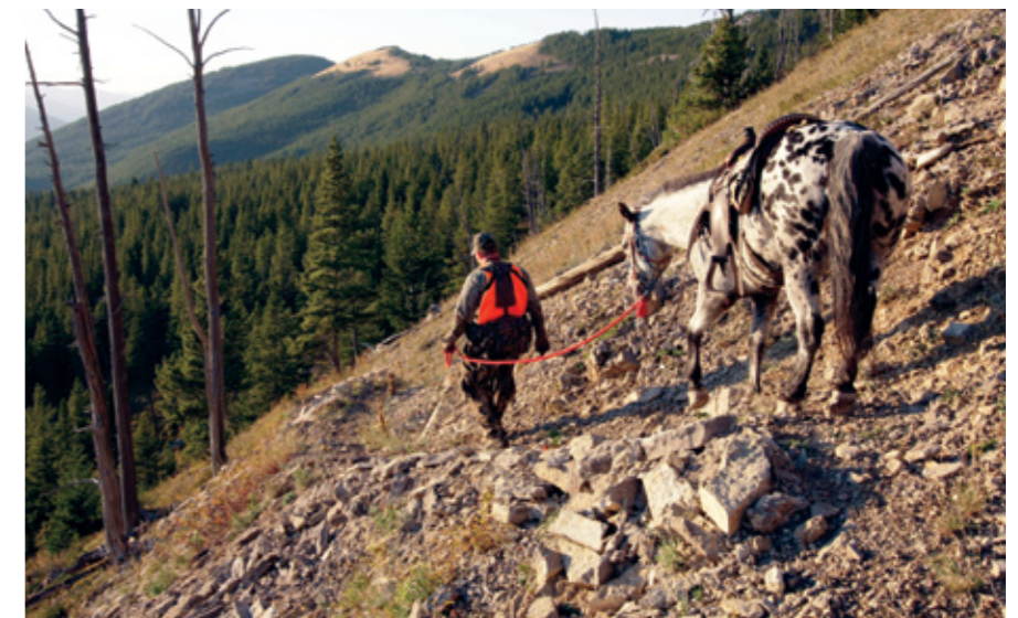
Охота на оленей в глуши предполагает многие дни переходов по пересеченной местности, как пешком, так и в седле.