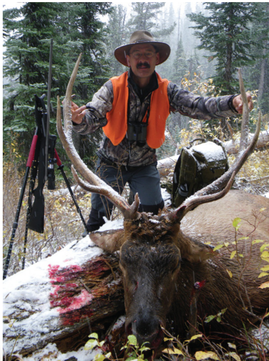
Зов этого быка 5x5 волнует так же, как и оленья охота.