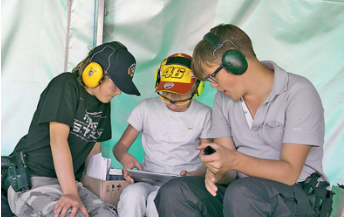
Современные тинейджеры даже на стрельбище не могут обходиться без высоких технологий. Для них планшетный компьютер – неотъемлемый атрибут для психо-эмоциональной разгрузки

могут отслеживать рост своих результатов в процессе интенсивных тренировок.