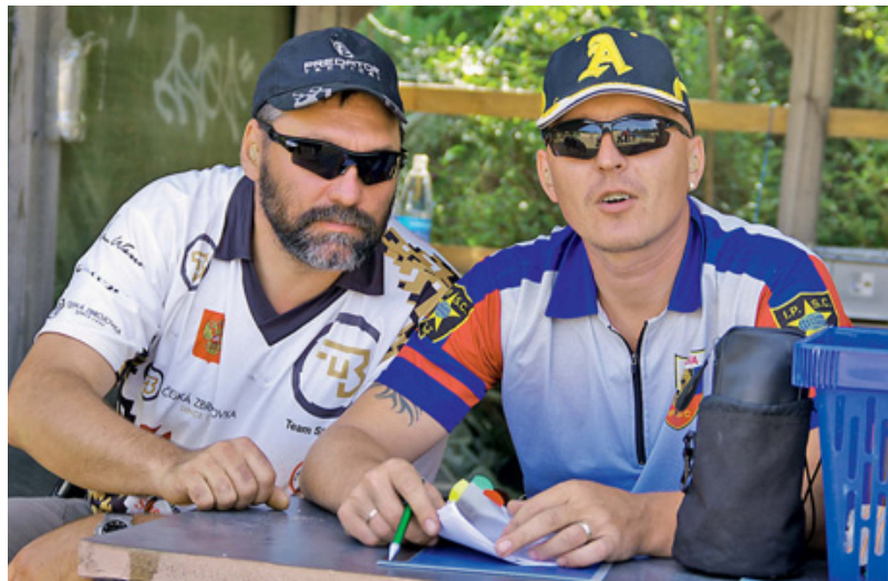
Никто не знает, что обсуждали и писали за спинами стрелков эти два человека в тёмных очках...