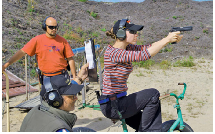
На этом фото хорошо видно одно из «инквизиторских» учебных пособий курсов – когда-то давно это было велосипедом