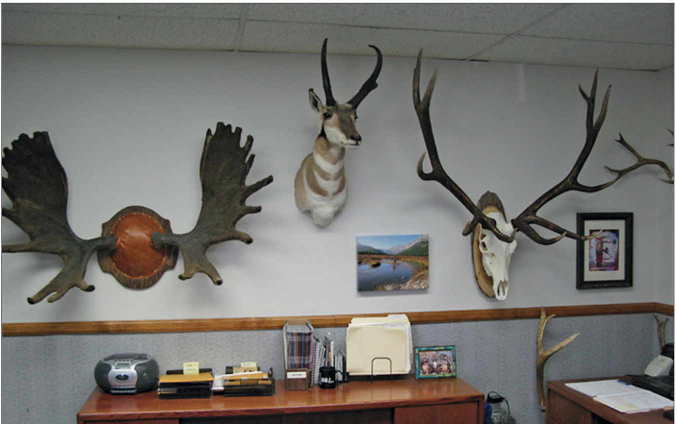
Воспоминания, а не бахвальство, – вот почему очень многие хранят «меморалии» о своих охотах

Эта печальная картина ясно показывает, что, хотя бизоны и были источником мяса, но приобретаемый в ходе их преследования и добычи опыт сам по себе очень много значил для существования и духовного содержания тех культур. Ведь так много уроков кроется в зрелище этих непревзойдённых наездников, преследующих грузно бредущий скот, причём практически на глазах у тех, кто намеренно уничтожил их образ жизни. Это