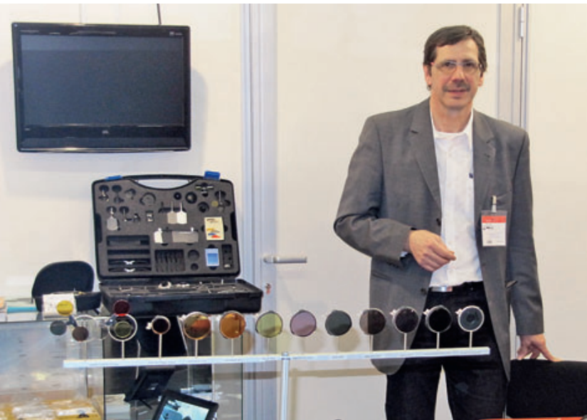
Стенды стрелковых «очёчников» Knobloch (слева) и Champion