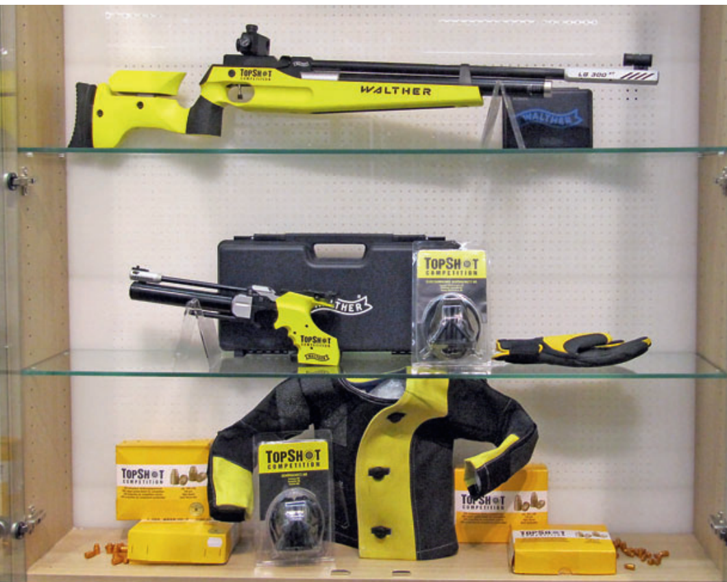
«Яркая» продукция торговой марки Top Shot