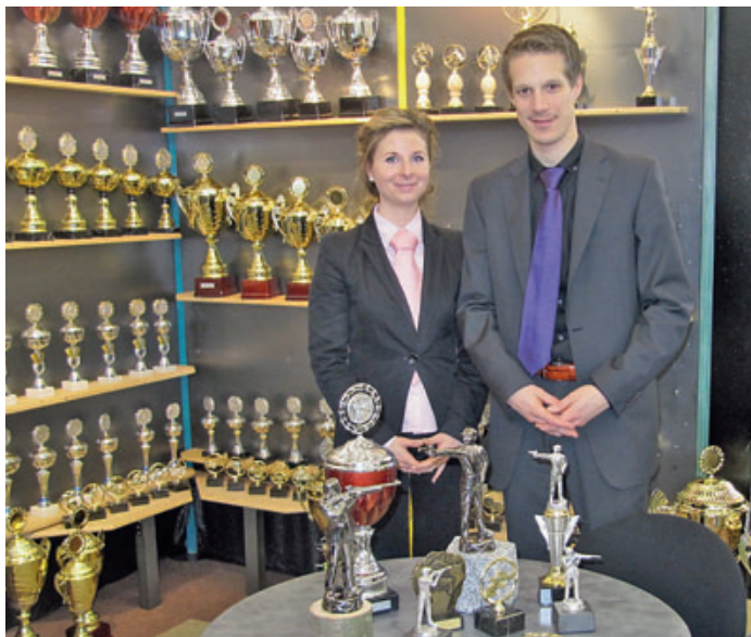
Стрелковые кубки фирмы DNL