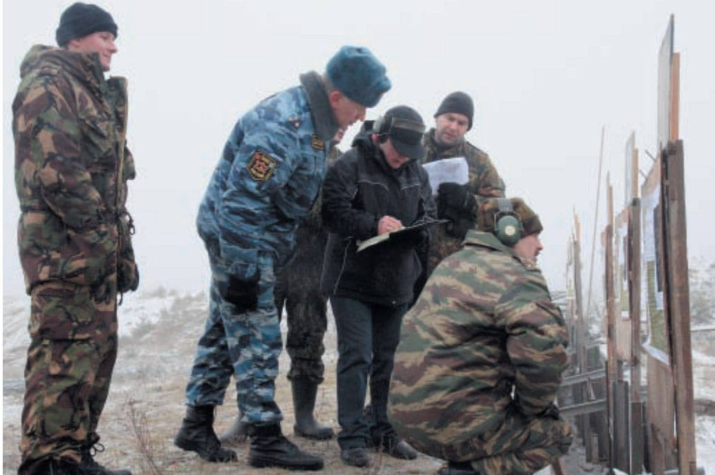
Объективное суждение не вызывало никаких нареканий

Стартовая позиция перед выполнением оперативно-тактического упражнения. Стрелкам заранее не были известны ни положение для стрельбы, ни угол места, ни расстояние до цели