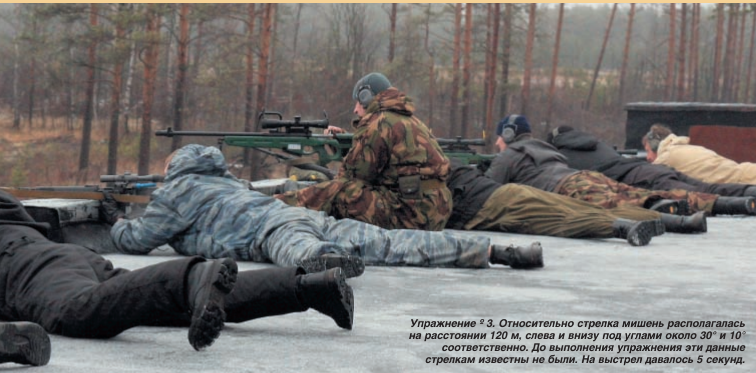
Упражнение № 3. Относительно стрелка мишень располагалась на расстоянии 120 м, слева и внизу под углами около 30° и 10° соответственно. До выполнения упражнения эти данные стрелкам известны не были. На выстрел давалось 5 секунд.