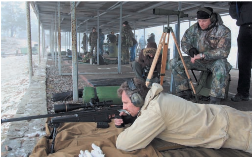
Упражнение выполняет команда победителей первенства