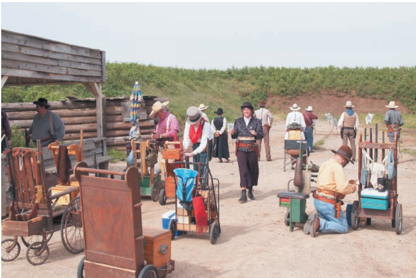
Группа ковбоев выполнив одно упражнение переходит на другое

пошитую согласно сохранившимся с тех времён моделям или по образцам костюмов героев вестернов. Стрелки обязаны носить историческую одежду на всех мероприятиях, включая церемонии открытия, награждения, торжественные ужины, танцы и т. д. Каждый ковбой должен подобрать себе прозвище. Это может быть какая-то историческая персона времён Старого Запада, имя киногероя