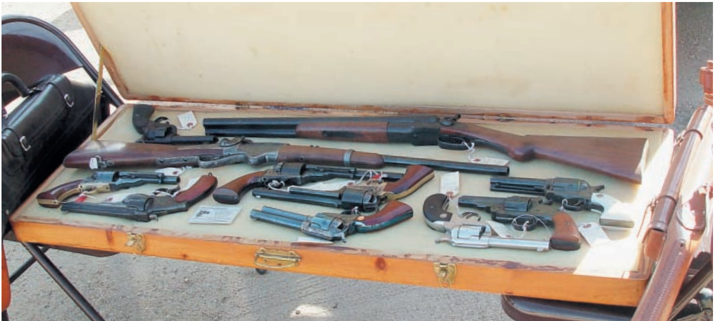
В ковбойской лавке можно приобрести любое оружие для соревнований