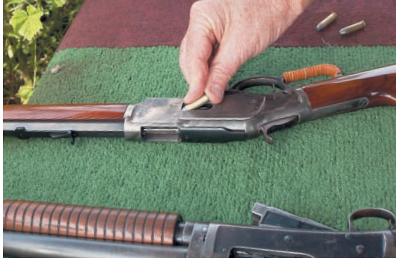
Заряжание подствольного магазина винтовки Winchester Musket образца 1873 года калибра .44

Револьверы в ковбойской стрельбе в особом почёте. По типу револьвера стрелки разбиваются на шесть классов: «Модерн», «Традиционный», «Фронтир Катридж», «Дуалист», «Ганфайтер» и «Фронтирсмен». Не буду подробно описывать каждый класс, хочу лишь сказать, что разделяются они по некоторым техническим моментам и стилю стрельбы, но все объединены одним важным свойством – используются револьверы одинарного действия. Это означает, что после каждого выстрела надо взводить курок. Ковбой виртуозно проделывают это действие большим пальцем сильной или слабой руки. Хочу только выделить класс «Ганфайтер». В этом классе стрелки могут стрелять сразу из двух револьверов. Поверьте, это забавное зрелище. Для револьверов используются патроны только со свинцовыми пулями. Заряды могут быть ослабленными.