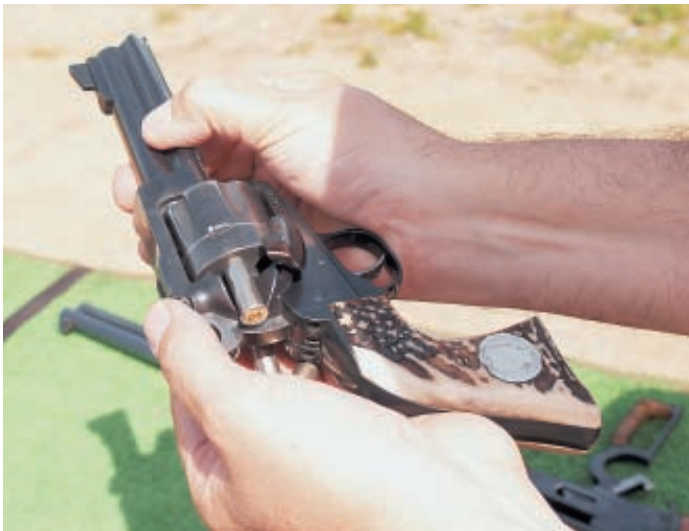
Разряжание и заряжание револьвера одинарного действия