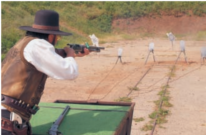
Ковбой поражает мишени дробью из ружья, затем будет стрелять из винтовки. Стрельба из револьвера в последнюю очередь. Упражнение выполняет Рон Штейн по прозвищу «Тупело Флэш». В свободное от соревнований время он ведёт популярное в Голливуде «Шоу Звёзд»

спортивную организацию, развивающую и продвигающую новый стрелковый вид спорта – ковбойскую стрельбу. Количество членов организации превысило 60 000 человек объединённых в 500 клубов и представляющих 18 стран мира.