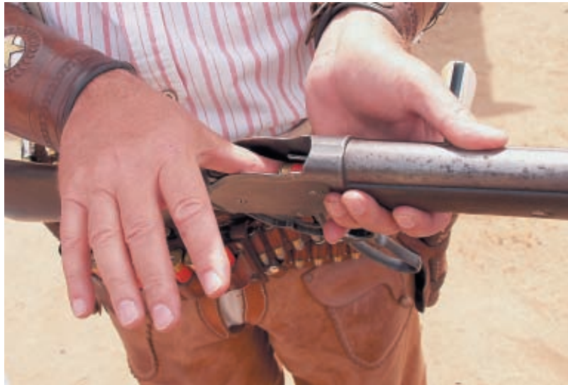
Так заряжается Winchester Model 1887 г.