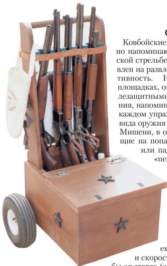
У каждого стрелка особая деревянная тележка наполненная ружьями, винтовками и другим снаряжением конца XIX века