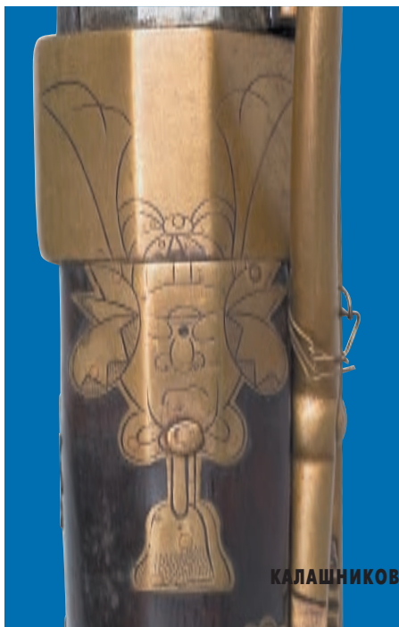
Сверху на прикладе ружья – накладка в виде головы самурая в шлеме с рогами кувагата