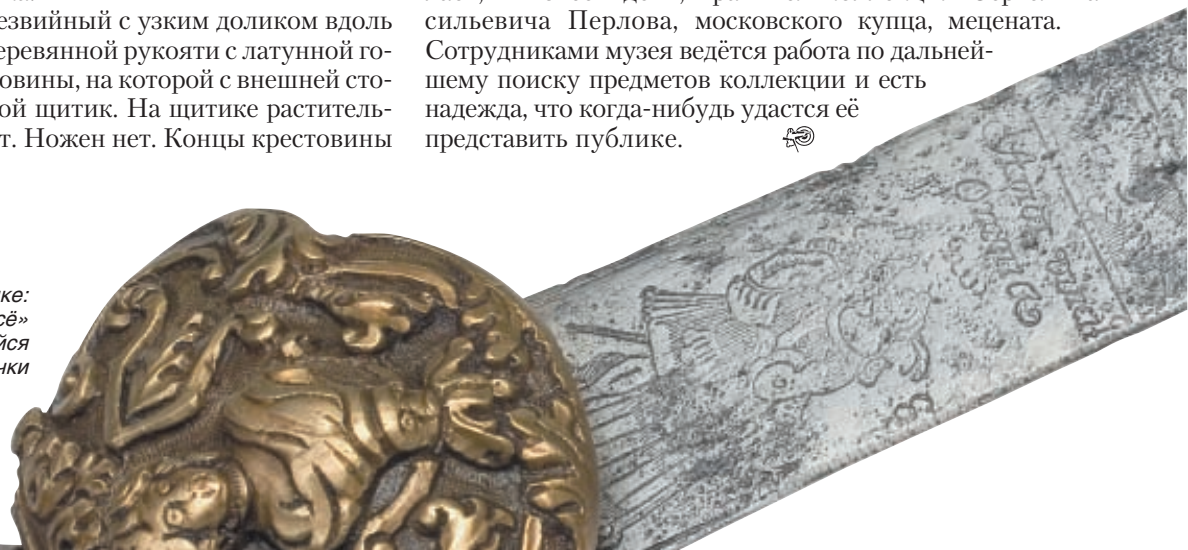
Надпись на немецком кортике: «Любовь побеждает всё» и изображение целующейся парочки

Сотрудниками музея ведётся работа по дальнейшему поиску предметов коллекции и есть надежда, что когда-нибудь удастся её представить публике.