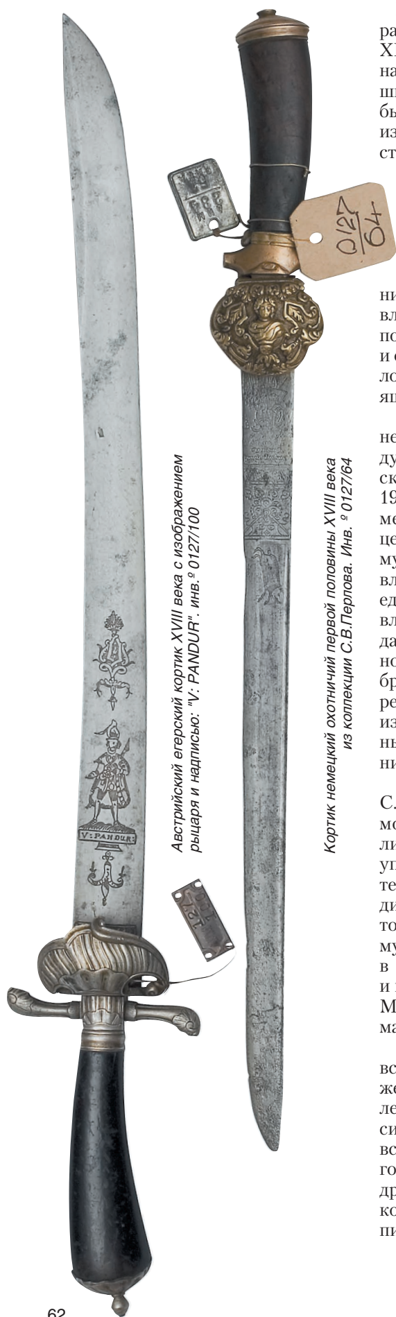
Австрийский егерский кортик XVIII века с изображением рыцаря и надписью: "V. RANDUR". инв. № 0127/100