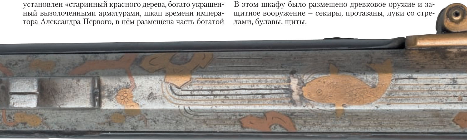
На казённой части ствола ружья изображён пейзаж, нанесённый путём насечки красной и желтой медью, – водопад и карп, выпрыгивающий из воды, над ним сосновые ветки

коллекции древнего вооружения, собранной известным московским коллекционером С. В. Перловым. Коллекция эта поступила из московского музея 1812 года». В этом шкафу было размещено древковое оружие и защитное вооружение – секиры, протазаны, луки со стрелами, булавы, щиты.