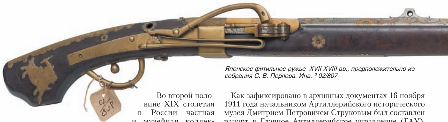
Японское фитильное ружье XVII-XVIII вв., предположительно из собрания С. В. Перлова. Инв. № 02/807

Во второй половине XIX столетия в России частная и музейная коллекционная деятельность переживала невиданный подъём, и в Москве, крупнейшем городе России, коллекционирование было одним из самых модных увлечений.