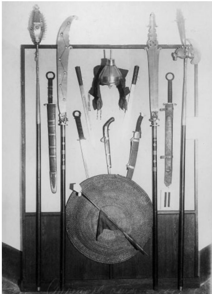
Стенд с китайским оружием, экспозиции музея 1937 года

инвентарным номером 0127/64 хранится кортик немецкий охотничий первой половины XVIII века. В верхней части клинок украшен травлением: с одной стороны изображение бегущего оленя, под ним растительный орнамент и надпись «а) War ich so weis als wie ein Schwan, kont ich so oft als wie ein Han, kont ich singen wie ein nachtagall so liebten mich die Jungfern all» (Если бы я был таким же белым как лебедь и мог бы также часто как петух, пел бы как соловей, то меня любили бы все девушки). С другой стороны изображение кабана, растительный орнамент и надпись «Amor vincit omnia.» («Любовь побеждает всё») и изображение целующейся парочки, одетой по моде XVIII века.