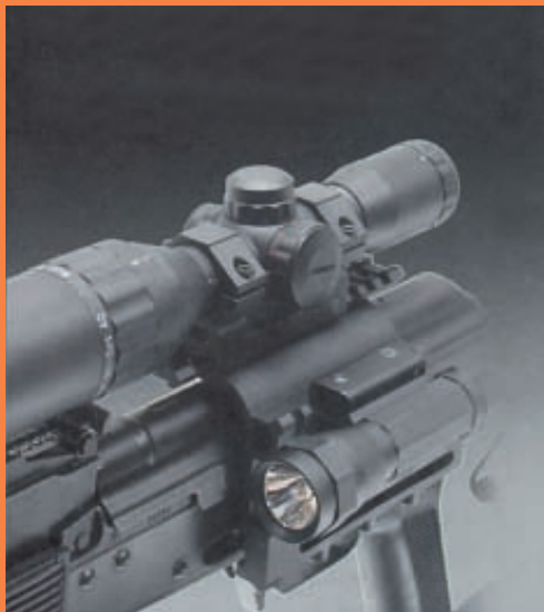
Слева. Аксессуары «Липерс» установленные на крышку ствольной коробки АК/«Сайга» с интегрированной планкой «пикатини»