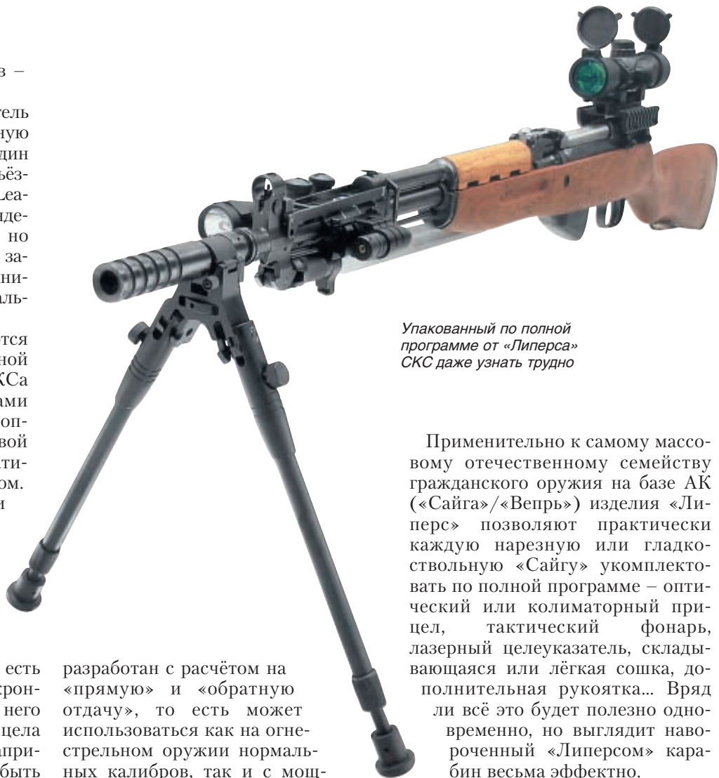
Упакованный по полной программе от «Липерса» СКС даже узнать трудно

А один из испытываемых оптических прицелов интересен тем, что