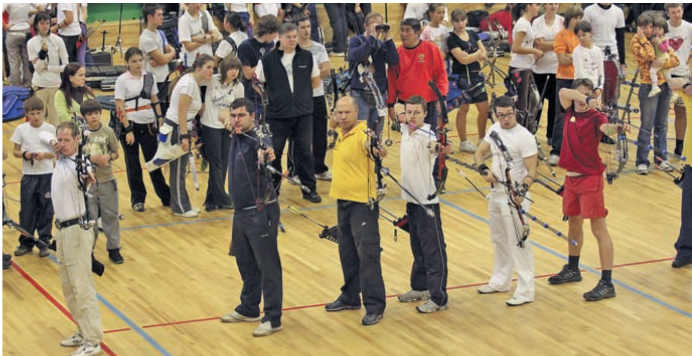
В этом году были добавлены и старшие возрастные группы, что вывело этот турнир на новый уровень