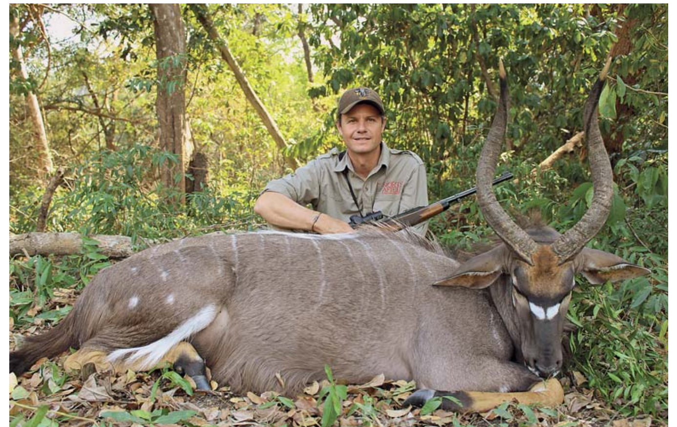
Ньяла – одна из наиболее поразительных винторогих антилоп в Африке

Через час или два, когда буйволы всё ещё не шевелились, мы решили попробовать сделать что-нибудь. Мы все остались укрытыми в осоке, но один из следопытов начал обходить стадо, держа направление по ветру, чтобы буйволы учуяли его запах. Мы надеялись, что это заставит буйволов встать на ноги и двинуться в нашем направлении. Учув следопыта, буйволы начали подниматься с лёжки и оглядываться в поисках чужака. Вскоре они начали движение в нашем направлении.