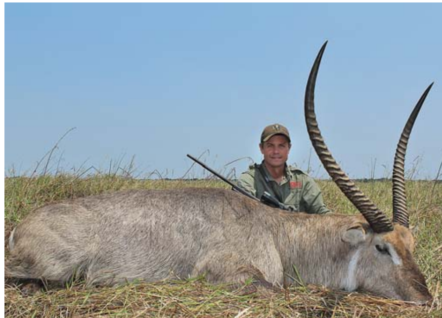
Водяные козлы просто кишат в этих краях; но этот – на редкость велик

Пригнувшись, мы вошли в мелкую протоку и начали подползать на четвереньках к дичи, сокращая дистанцию. Через несколько сотен ярдов укрытие кончилось, но мы были всё ещё слишком далеко для надёжного выстрела. Козёл был из стада, и животные теперь могли видеть нас, так что они беспокойно двинулись прочь. Мы шли параллельно направлению их движения, сокращая дистанцию на ходу. Я померил расстояние до крупного козла – 350 ярдов. Мы