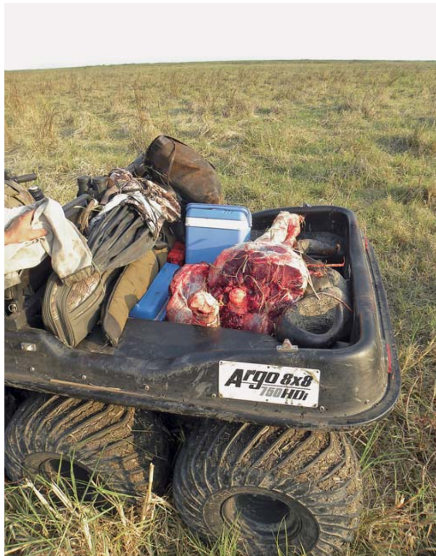
Возможности транспортёров «Арго» перевозить весьма тяжёлые грузы относительно своих скромных размеров идеально подходят для транспортировки сотен фунтов буйволиного мяса из болот, а также и охотников со всем их снаряжением