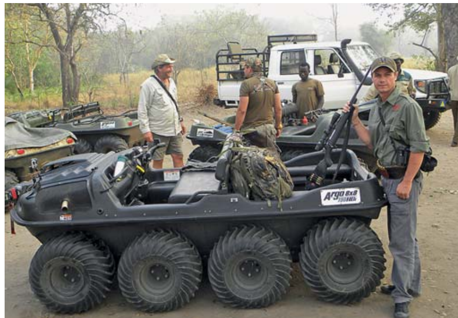
Универсальный транспортёр-амфибия «Арго» с восемью ведущими колёсами просто неоценим для доставки охотников в места с ненадёжной болотистой почвой и возвращения их оттуда