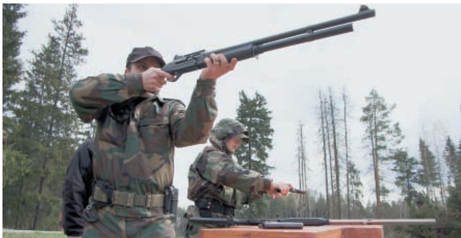
Специфика соревнований – смешанные команды. Женщины сильный пол не подвели!

Командная дуэльная стрельба включала в себя поражение двумя стрелками одной команды поля пистолетных падающих мишеней, разряжание оружия, смену вида оружия, поражение поля оружейных «попперов» и только после этого поражение зачётного «поппера». Командная дуэль по своему накалу