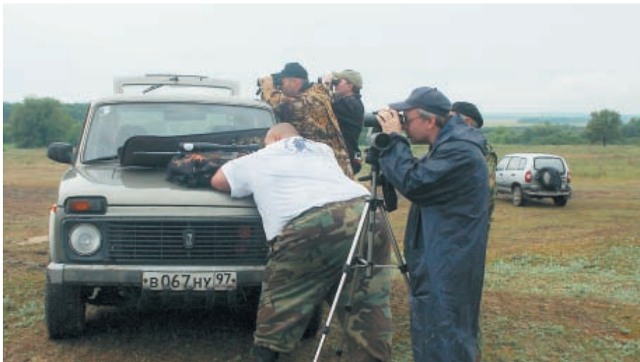
Многие участники турнира стреляли с капотов своих машин...