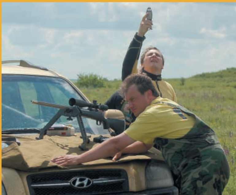
На варминтинге без баллистических расчетов не обойтись.