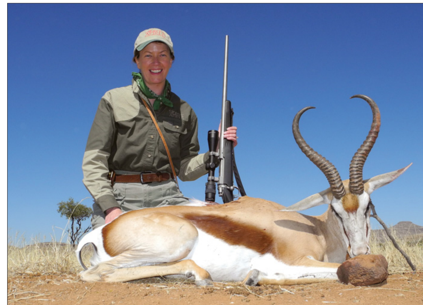
Туристы на фотосафари склонны предпочитать легкодоступные районы, где водится много дичи. А вот охотники предпочитают забираться в глушь, подальше от исхоженных дорог, чтобы заполучить возможность добыть по-настоящему хороший трофей, как вот этот калахарский спрингбок, взятый в Намибии, в отдалённом резервате Оматендека