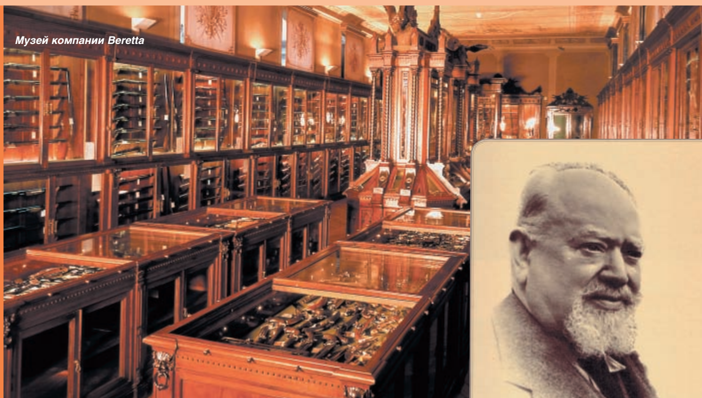
Музей компании Beretta