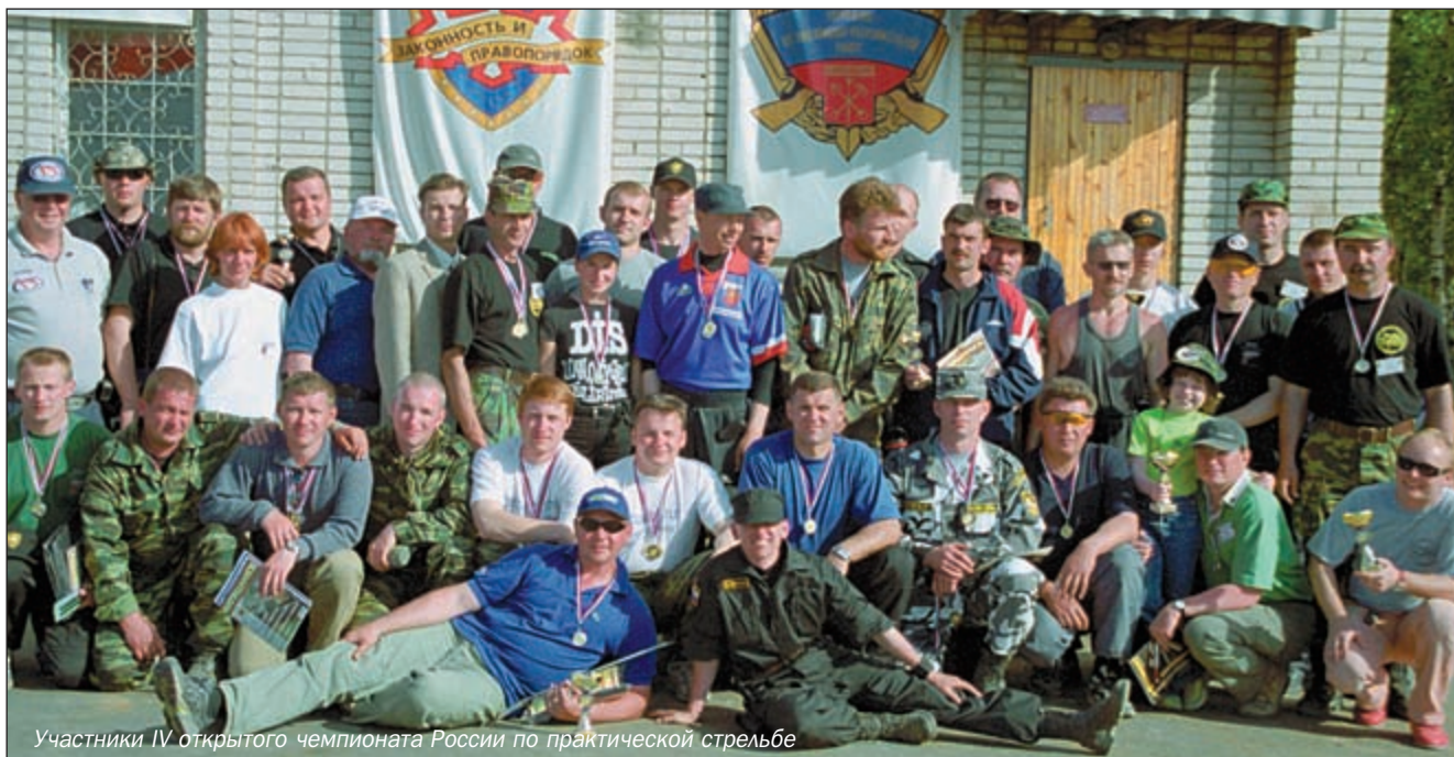
Участники IV открытого чемпионата России по практической стрельбе

дачи. Большую помощь оказали фирмы «ХОРС», Глава муниципального образования Шувалово-Озерки и многие другие, за что им большое спасибо от всех любителей практической стрельбы. 🏆