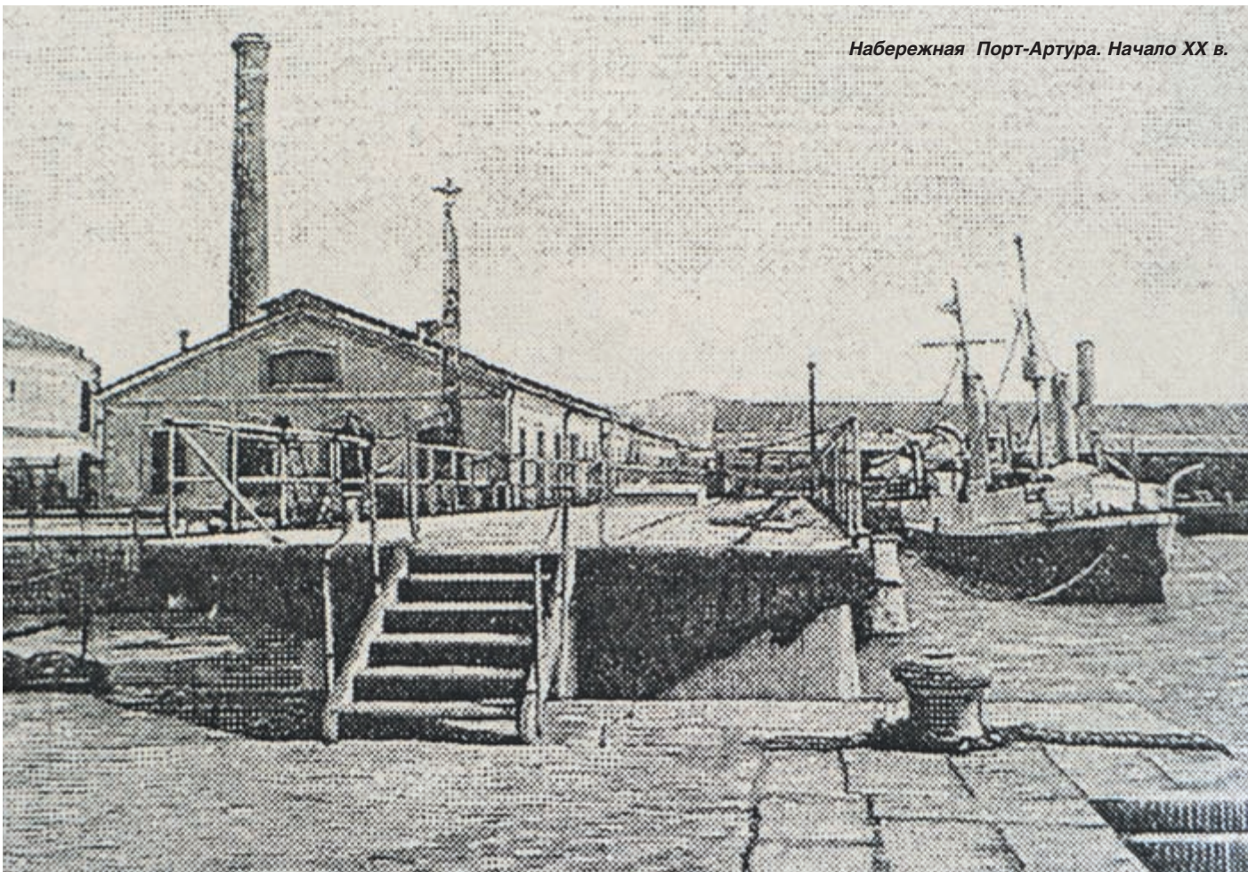
Набережная Порт-Артура. Начало XX в.

При подготовке статьи использовались документы, хранящиеся в Государственном архиве Российской Федерации.