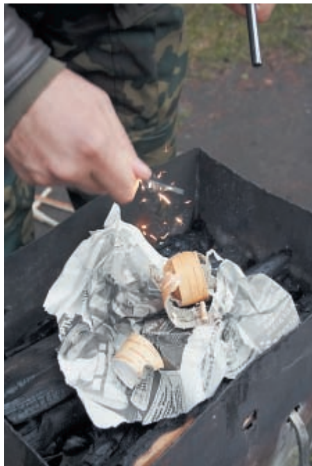
Заготовка лучинок разжигание огня с помощью огнива и чмака

деревянные обтянутые натуральной кожей водяного буйвола подвержены короблению и усадке при повышенной влажности и последующем высыхании. Поэтому после, а ещё лучше и до, и после охоты или просто пребывания с клинком на улице, особенно в осенне-зимнее ненастье, клинок и ножны нужно обработать влаго-отталкивающим и смазывающим составом. Первоначально новые нож и ножны покрыты восковой смазкой (предположительно по составу напоминающей воск карнаубы), но со временем при постоянном ношении и использовании ножа это