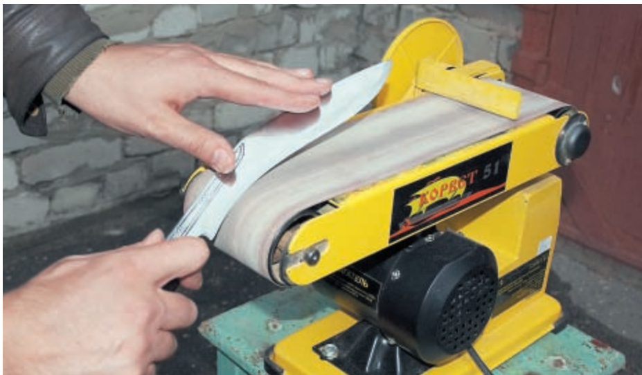
Заточка кукри на ленто-шлифовальной машине

В перерывах между охотами пара настоящих боевых непальских кукри украшает интерьер, разместившись на ковре в окружении шашки, нагайки, казачьего кинжала, охотничьего рога и прочих охотничьих и казачьих атрибутов, вызывая восторг и восхищение у мужской половины и легкий визг от страха и возбуждения (я так полагаю, кто поймет этих женщин?) у женской. И теперь уж, я свои клинки никому не отдам.