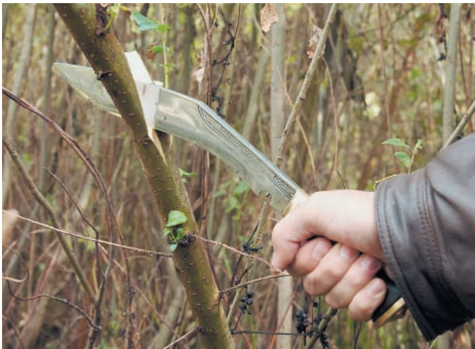
При определённом навыке нож позволяет уверенно рубить лозу