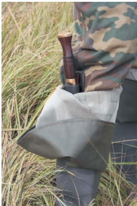
Один из способов ношения кукри на охоте

Производство ножей кукри, где-то полукустарное, но это не является недостатком для любителей и ценителей ножей (во всяком случае, для меня лично). Когда берешь кукри в руки, то ощущаешь теплоту рук кузнеца ковавшего данный клинок. Не бездушные современные станки с ЧПУ, а именно седую старину эпохи великих завоеваний, когда человечество ещё не знало пороха, а на первый план выдвигалось именно умение и сила конкретного бойца, когда холодное оружие царило на полях сражения. Что-то неуволимо ведическое присутствует в этих ножах. И нет двух одинаковых клинков даже одной модели – какой-нибудь мелочью, но всё же они отличаются друг от друга и это здорово. Каждый характерный элемент кукри имеет не только практическое, но и символическое значение. Декоративный рисунок в виде желобка, ошибочно называемый кровостоком, носит название «меч Шивы» – служит для жёсткости и повышения амортизирующих свойств клинка, даёт кукри силу оружия бога Шивы. Поперечные кольца на рукояти обеспечивают уверенное удержание клинка даже во влажной руке и символизируют собой уровни мироздания. Лезвие с переменным углом заточки даёт максимальную эффективность при рубящих, режущих и колющих ударах и символизирует Солнце и Луну –