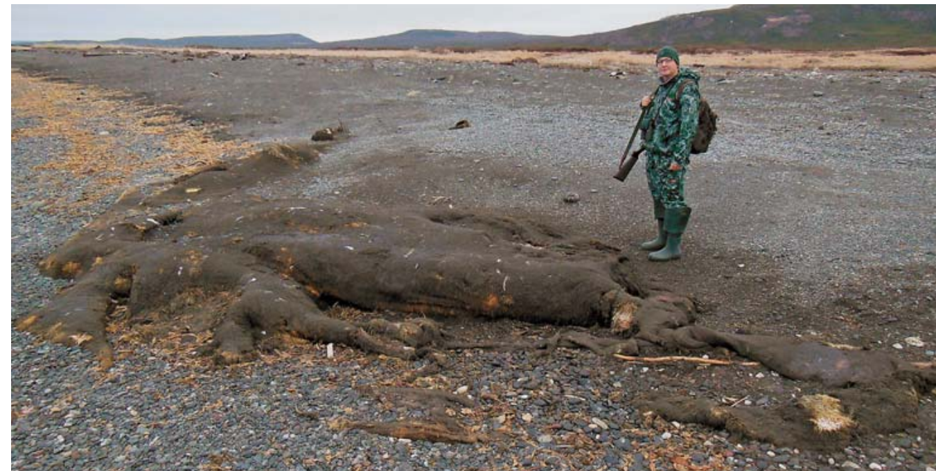
Останки выброшенного на берег кита – отличная естественная привада для камчатских медведей.

Импровизировали на ходу – и рядом с бывшей столицей Корякского автономного округа есть охотничьи угодья, конечно, не такие интересные и изрядно «потопанные», но выбирать уже не приходилось.