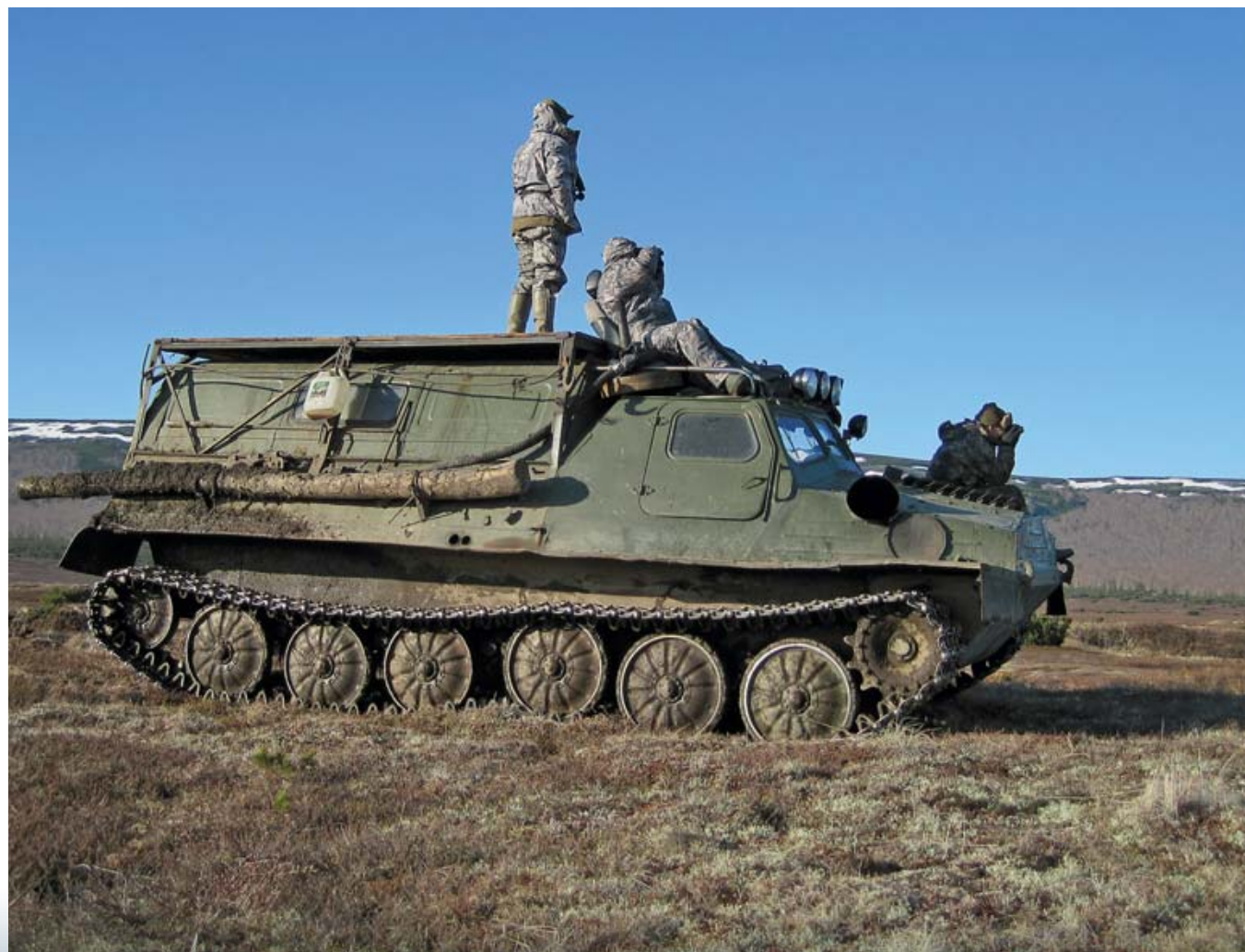
«Биноклевание» тундры и сопки – это занятие, на которое уходит львиная доля времени на камчатских охотах

Планировать что-то на Камчатке, как, впрочем, и в любых других экспедициях на «край карты», безусловно, можно и нужно, но реалии чаще всего ничего общего с планами не имеют. Так же вышло и у нас. За оставшиеся пять дней охоты нам никак было не успеть «заброситься», отохотиться, а самое главное – вовремя вернуться обратно в Палану.