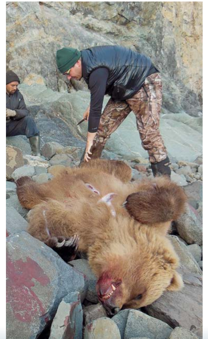
Это был самый скоростной «скиннинг» медведя в моей жизни – прилив подступал прямо на глазах