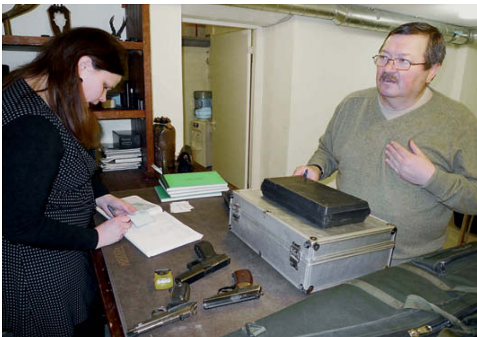
В хранилище «Оксалиса» сдаёт свои пистолеты и учебный центр, готовящий граждан Литвы к получению лицензии на приобретение оружия. Его директор как раз приехал в мастерскую во время нашего визита