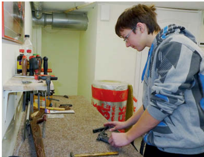
Сыновья оружейного мастера уже освоили азы ремонта пневматики и работы с деревом

В этой оружейной комнате хранятся ружья, каждый литовский владелец оружия может оставить свой арсенал в межсезонье или при длительной отлучке