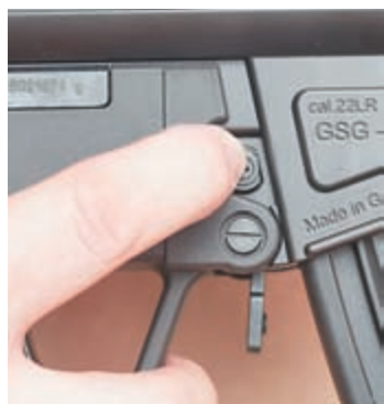
Для отсоединения магазина нужно нажать либо на кнопку (на фото), либо на рычаг перед спусковой скобой

Прелесть GSG-5 не только в эффектной внешности, но и в возможности до бесконечности её совершенствовать по аналогии с многообразием боевых модификаций. Причём все подходящие аксессуары поставляются в Россию через официального экспортёра GSG-5 немецкую фирму Waffen-Schumacher.