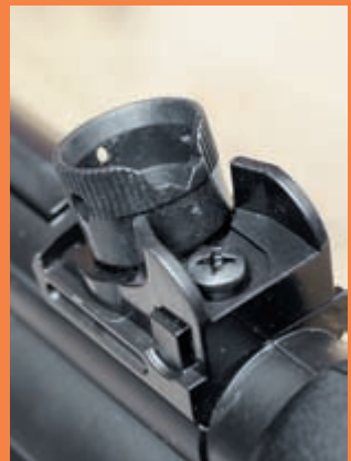
Механический прицел состоит из неподвижной мушки и регулируемого целика