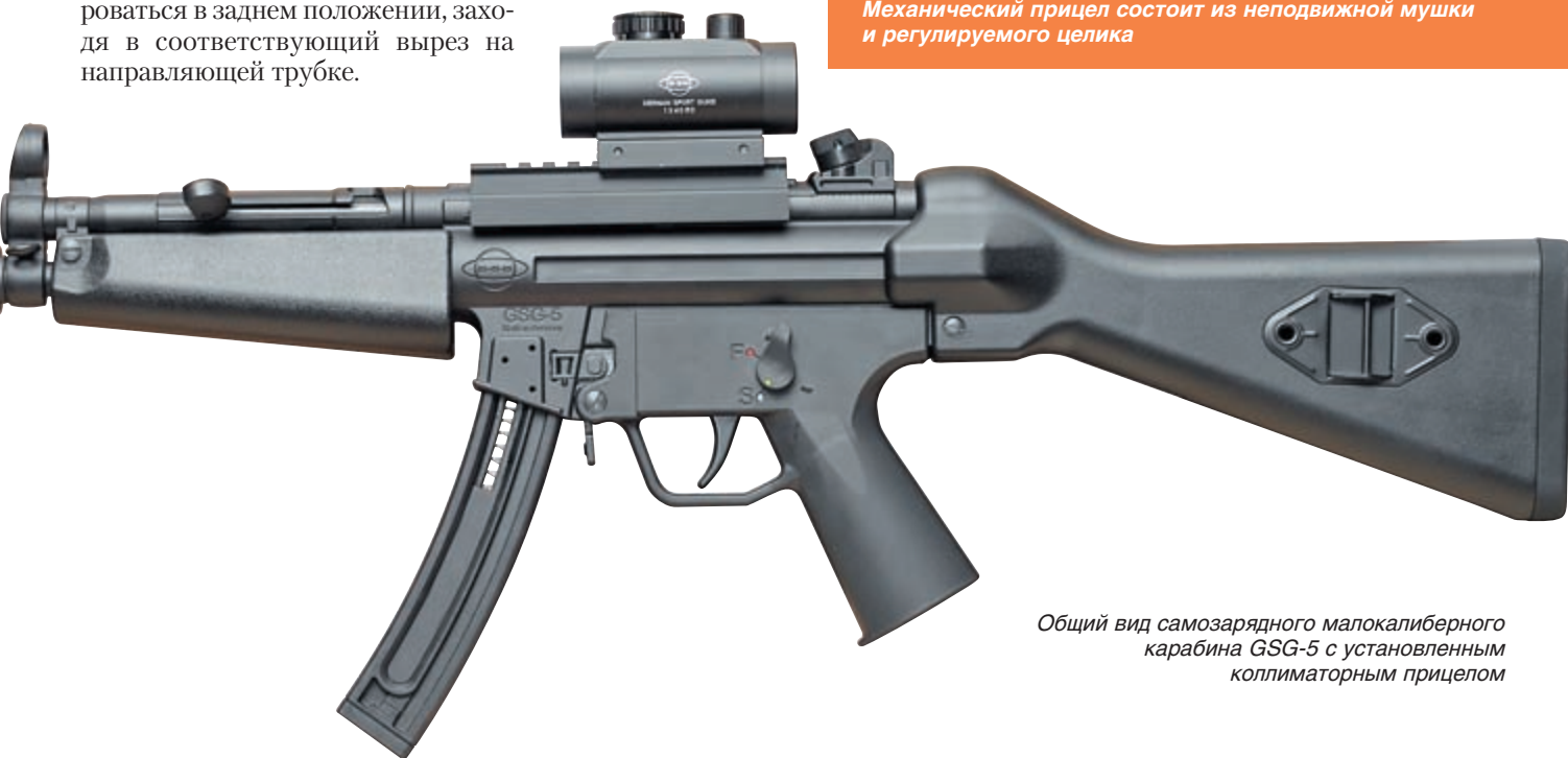
Общий вид самозарядного малокалиберного карабина GSG-5 с установленным коллиматорным прицелом