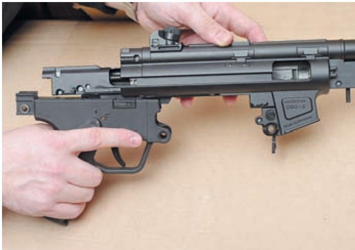
После отделения приклада, спусковая коробка вместе со ствольной коробкой извлекается из корпуса карабина