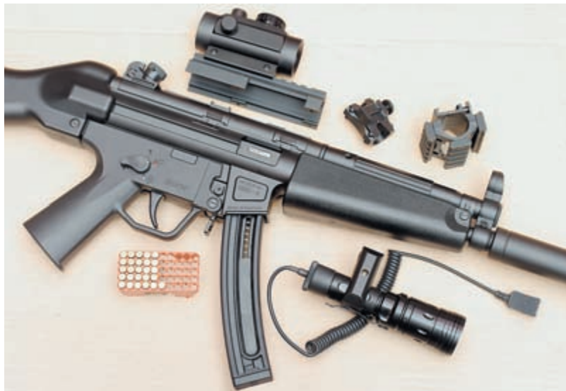
На GSG-5 можно установить все внешние атрибуты, присущие боевому пистолету-пулемёту

Как и у 9-мм образца, у GSG-5 рукоятка взведения затвора находится с левой стороны оружия над цевьем. Рукоятка не имеет жёсткой связи с затвором и может фиксироваться в заднем положении, заходя в соответствующий вырез на направляющей трубке.