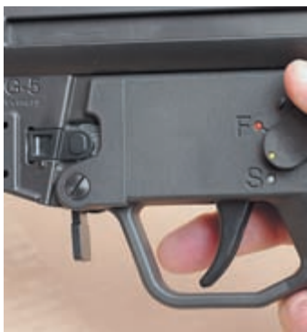
Рычаги предохранителя расположены по обе стороны оружия