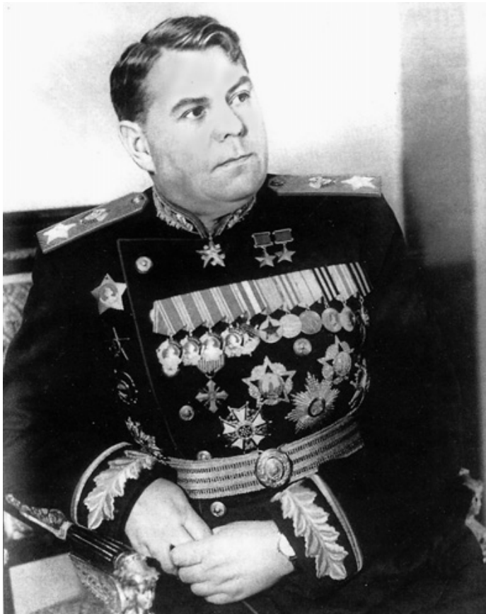
Дважды кавалер полководческого ордена «Победа», дважды Герой Советского Союза, Маршал Советского Союза Александр Михайлович Василевский

утром в войну Советского Союза ставит нас окончательно в безвыходное положение и делает невозможным дальнейшее продолжение войны».