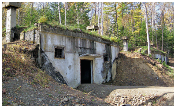
Японские пороховые погреба. Сахалин, 50-я параллель