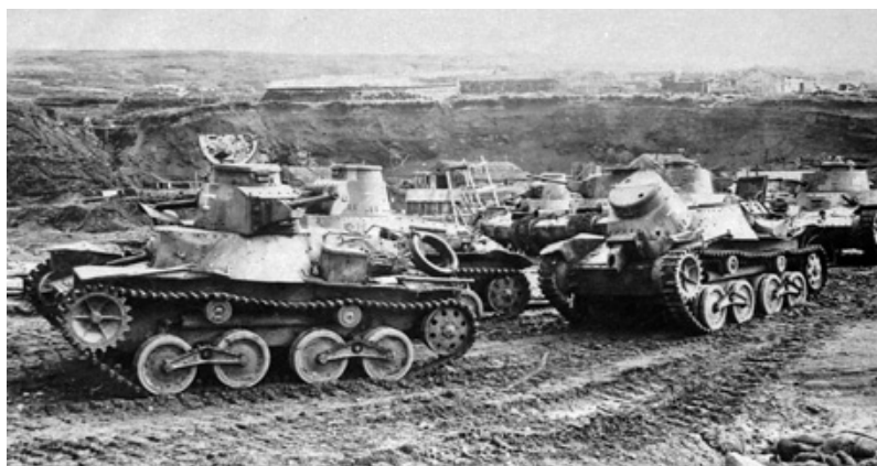
Захваченные японские танки на военной базе Катаока