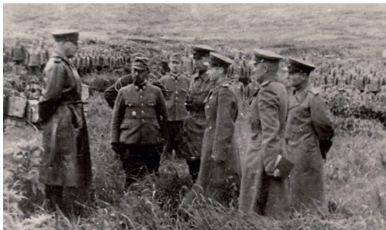
Допрос пленных японцев

Участие в войне советских войск явилось решающим фактором для принуждения Японии к миру, что признавали и сами японцы. В день вступления СССР в войну с Японией – 9 августа 1945 г. на экстренном заседании Высшего совета по руководству войной премьер-министр Японии Судзуки заявил: «Вступление сегодня