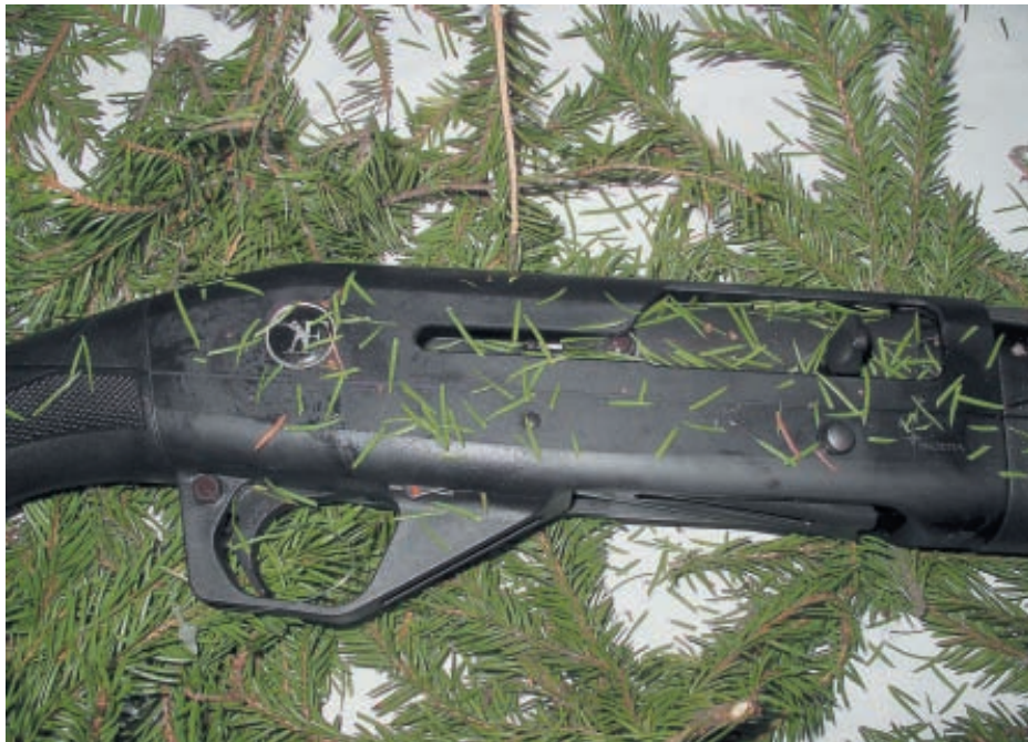
Все возможные и невозможные щели были заполнены еловой хвоей

Надо отметить, что я не сторонник таких жёстких экспериментов с оружием, но их результаты впечатляют. Конечно, мы отдаем себе отчёт в том, что по сути это обычная опытная стрельба, результаты которой не могут быть репрезентативными для какой-то статистической выборки. И всё же факт, даже единственный – упрямая вещь, он расширяет границы наших познаний и наглядно