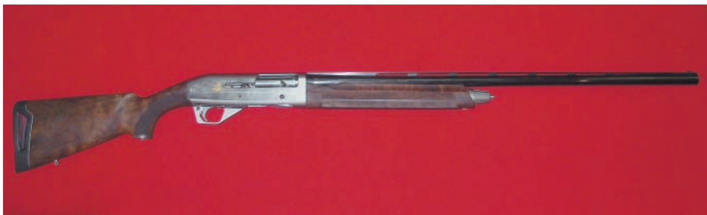
Ружьё Franchi Inertia Limited Edition Elite – лучший подарок охотнику в новом году