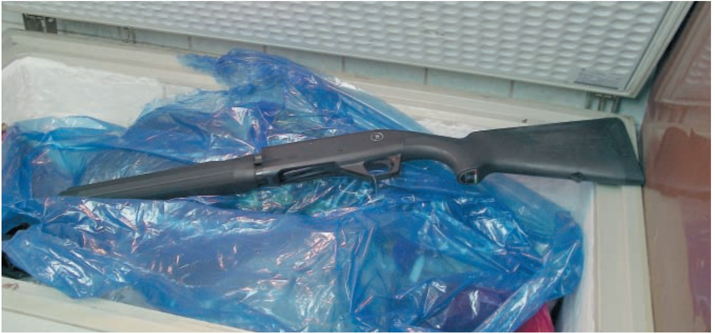
Ружьё было подвергнуто заморозке в морозильной камере

По доступной нам статистике наибольшим спросом сейчас пользуется отечественная «газоотводка» МР-153, и импортные ружья с инерционным затвором. Напрашивается смелый вывод, что именно «инерционники» в этом столетии постепенно станут наиболее популярными самозарядными ружьями.