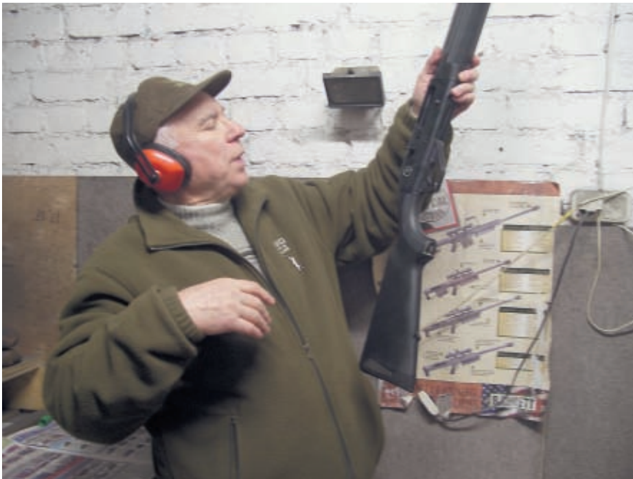
К охлаждённому до -24^{\circ}\text{C} ружью с трудом можно было прикоснуться, не обморозив пальцы рук

И всё же мы, охотники, наряду с изучением качества боя, прикладистости, баланса, массо-габаритных характеристик, в отношении вновь появившейся модели самозарядного ружья в большей степени интересуемся надёжностью работы его автоматики, особенно, в сложных и экстремальных условиях русской охоты. «Парковые» леса центральной Европы или даже ухоженную и вычищенную тайгу Финляндии или Швеции трудно сравнить с дебрями даже нашего Северо-Запада, не говоря уже о лесных угодьях Вятского