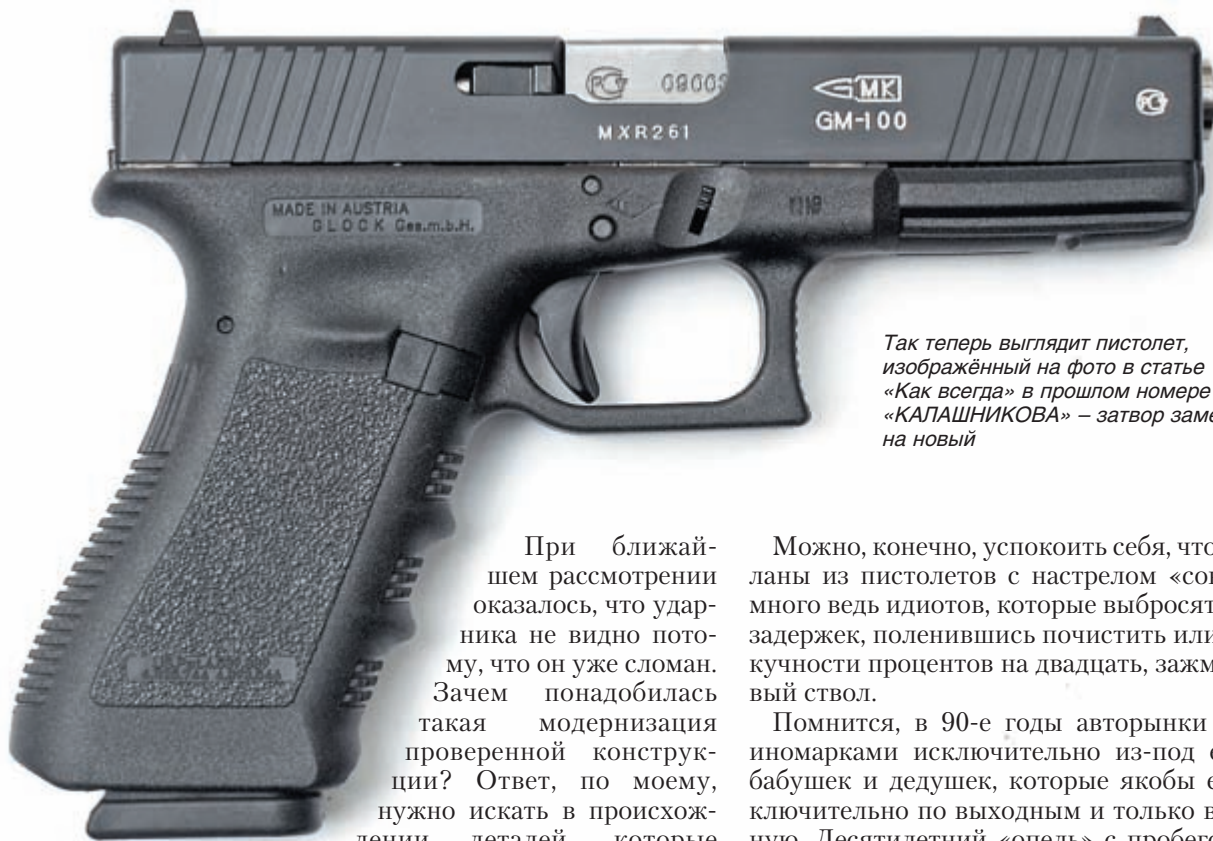
Так теперь выглядит пистолет, изображённый на фото в статье «Как всегда» в прошлом номере «КАЛАШНИКОВА» – затвор заменён на новый

При ближайшем рассмотрении оказалось, что ударника не видно потому, что он уже сломан. Зачем понадобилась такая модернизация проверенной конструкции? Ответ, по моему, нужно искать в происхождении деталей, которые «Триол» использовал для сборки нашей парочки. Второй пистолет (с рамкой и затвором от разных пистолетов!) развеял все сомнения относительно их макетной родословной.