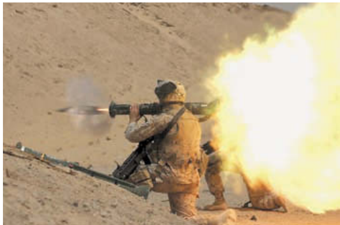
Выстрел из ручного противотанкового гранатомёта AT4

Следующим крупным событием в деле создания ручного противотанкового оружия стало появление однозарядного гранатомёта AT4, который ещё до официального принятия на вооружение участвовал в конкурсе на новое противотанковое средство для армии США, где его соперником оказался немецкий гранатомёт Armbrust. AT4 вышел победителем в этом конкурсе, хотя к его конструкции были предъявлены некоторые замечания, касающиеся, прежде всего, прицельных приспособлений. После незначительной доработки гранатомёт AT4 был принят на вооружение американской армии под обозначением M136 LAW. Шведы не возражали против таких изменений и приняли американизированный вариант AT4 под своим наименованием Pansarskott m/86 (Pskott m/86). Обычный для подобных гранатомётов недостаток заключался в том, что выстрел из него сопровождался своеобразным «задним дульным пламенем» – шлейфом, создающим за стрелком опасную зону. Нахождение в этой зоне было чревато получением серьёзных ожогов и ранений, вызываемых