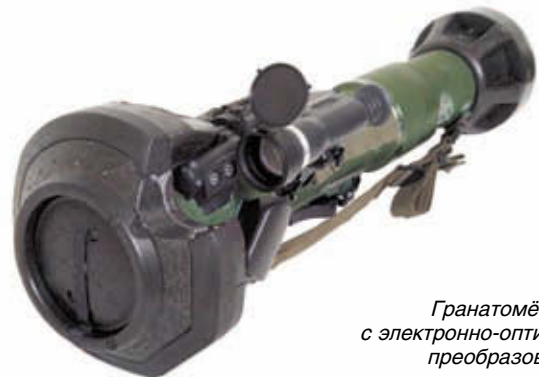
Гранатомёт NLAW с электронно-оптическим преобразователем

В 2006 году системе Predator было присвоено новое наименование – FMG-172 SRAW, и она существует в двух вариантах: противотанковом – FMG-172A и штурмовом – FMG-172B. Оба этих варианта проходят полевые испытания в подразделениях морской пехоты, но решения о принятии их на вооружение или развёртывании полномасштабного производства пока нет. Однако в США и других странах сейчас активно рассматриваются вопросы повышения огневых возможностей войск применительно к требованиям ведения боевых действий в городских условиях. Исходя из этого, компания Lockheed Martin рассчитывает на то, что её продукция имеет все шансы оказаться востребованной уже в самом ближайшем будущем.