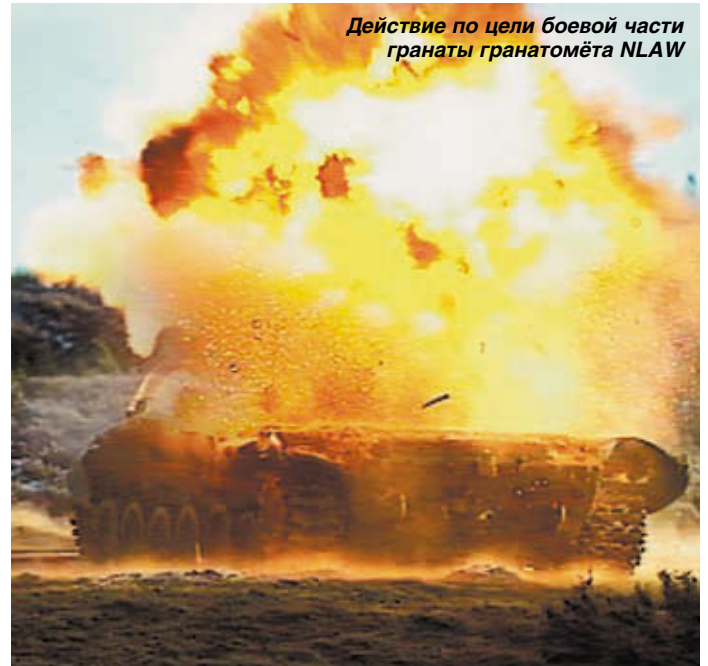
Действие по цели боевой части гранаты гранатомёта N LAW

техническое решение было использовано и при разработке гранатомёта N LAW.