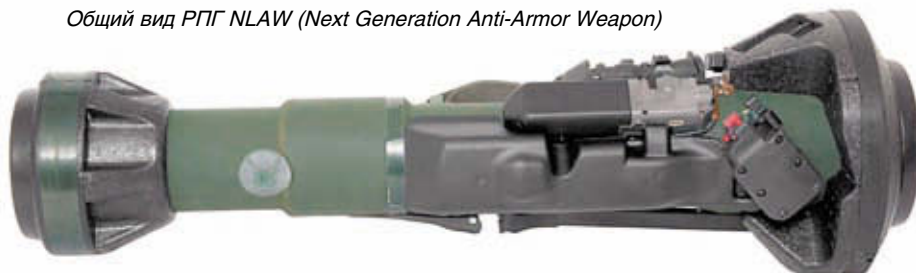
Общий вид РПГ NLaw (Next Generation Anti-Armor Weapon)

избыточным давлением. Этот эффект очень затруднял применение гранатомёта в городских условиях, особенно при ведении огня из закрытых помещений. Проблему огненного шлейфа удалось решить в модернизированном гранатомёте AT4 – CS (Confined Space – ограниченное пространство). В этом варианте используется противомасса в виде солевого раствора, ёмкость с которым помещается в тыльной части ствола. При выстреле жидкость распыляется, и образовавшийся аэрозоль связывает раскалённые пороховые газы и значительно уменьшает воздействие ударной волны. Такое