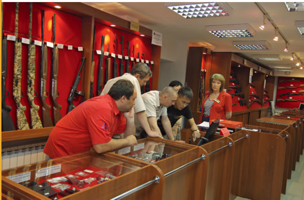
В головном магазине «Анны» во время моего визита был учебный день, собравший сотрудников всех магазинов сети, охватывающей Казахстан и Киргизию

Внушительный торговый комплекс и отдельный логистический центр «Коргана» произвёл на меня