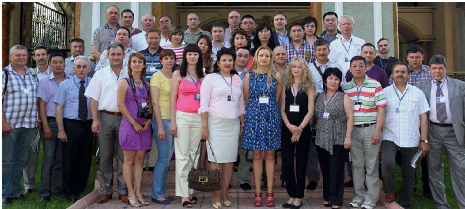
Участники собрания Ассоциации «Корамсак» в Алматы (май 2012 г.)