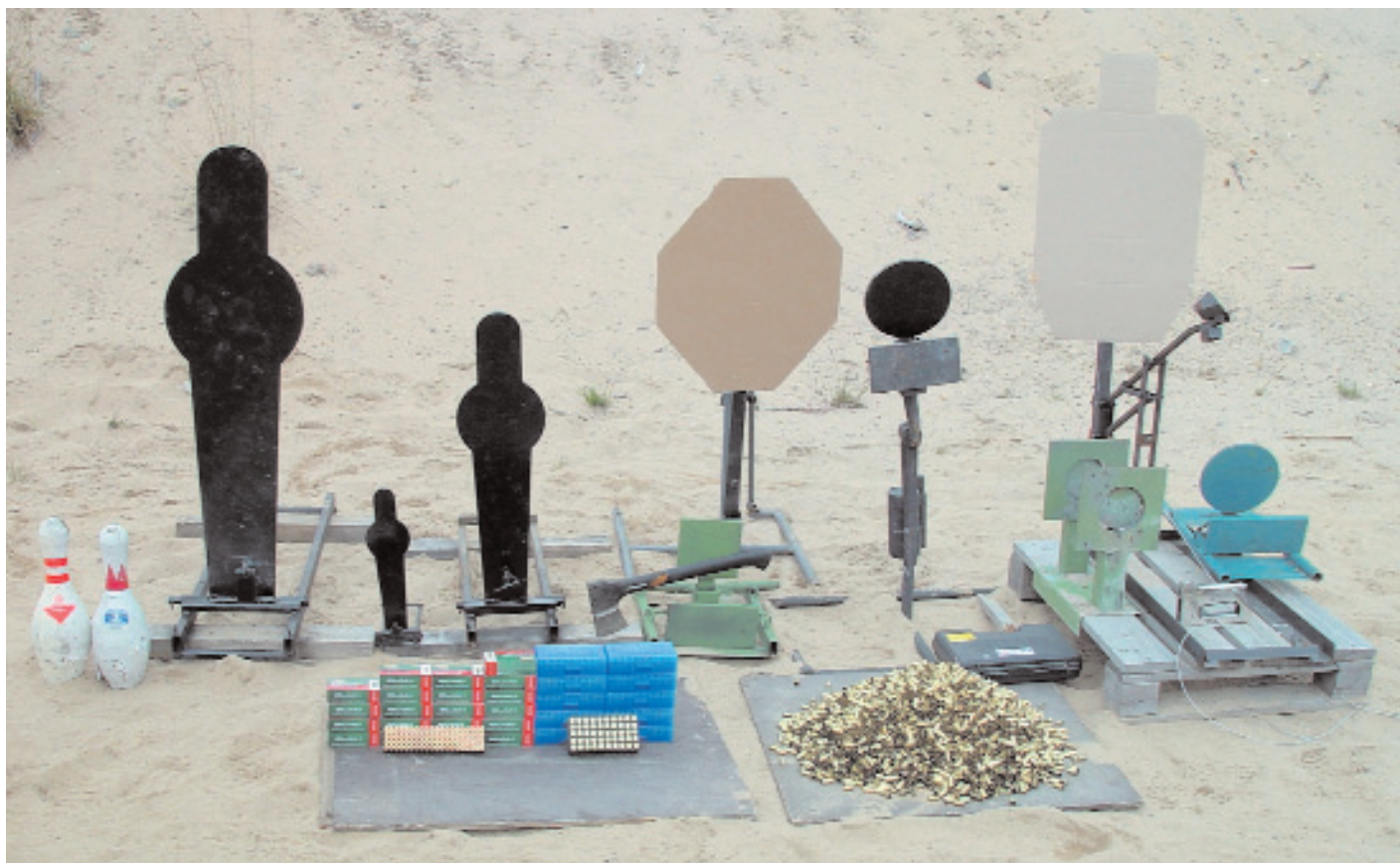
Большое разнообразие используемых мишеней – особенность практической стрельбы