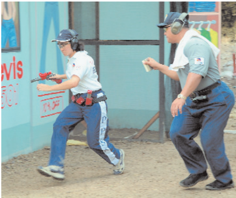
Судья с таймером фиксирует время стрельбы до сотой доли секунды. Стрельба на время – основное отличие практической стрельбы

После всего перечисленного становится понятно, что практическая стрельба это тот вид спорта, где гражданин обучается навыкам безопасного и квалифицированного обращения с оружием, где он получает достаточную физическую нагрузку на свежем воздухе, где на каждом соревновании он работает над собой, закаляя свой характер и обучаясь владению своими эмоциями!