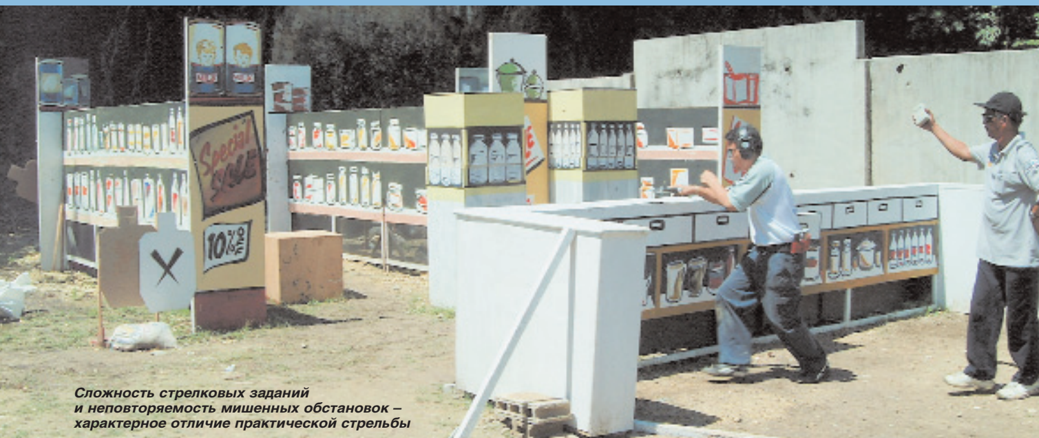
Сложность стрелковых заданий и неповторяемость мишеных обстановок – характерное отличие практической стрельбы