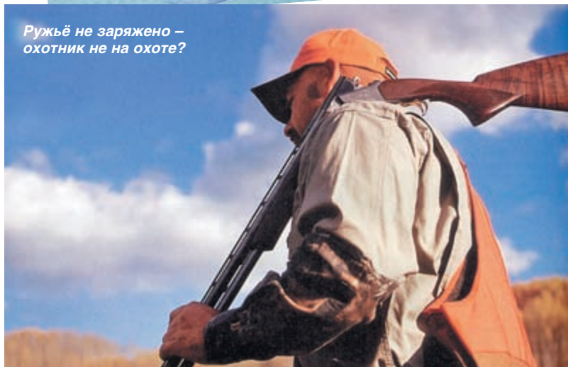
Ружьё не заряжено – охотник не на охоте?