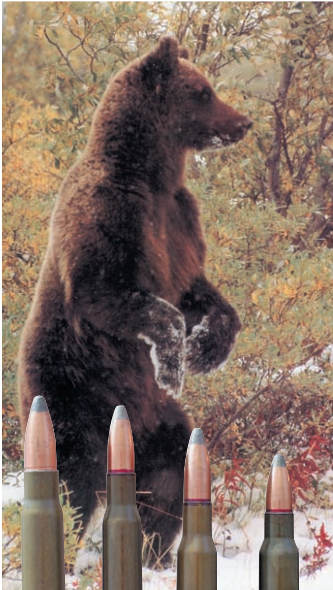
На фото патроны (слева направо): 9,3x64; 7,62x63; 7,62x54R; 7,62x51