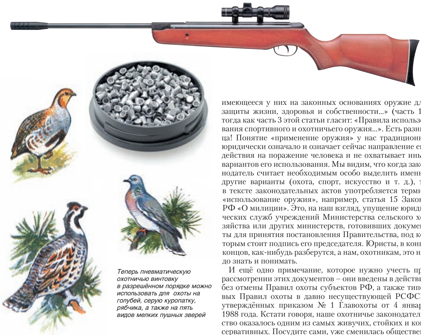
Теперь пневматическую охотничью винтовку в разрешённом порядке можно использовать для охоты на голубей, серую куропатку, рябчика, а также на пять видов мелких пушных зверей

уровень согласования нового постановления пока остается не ясным.