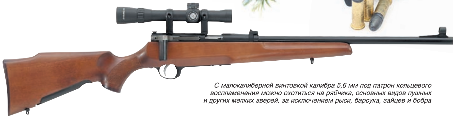
С малокалиберной винтовкой калибра 5,6 мм под патрон кольцевого воспламенения можно охотиться на рябчика, основных видов пушных и других мелких зверей, за исключением рыси, барсука, зайцев и бобра