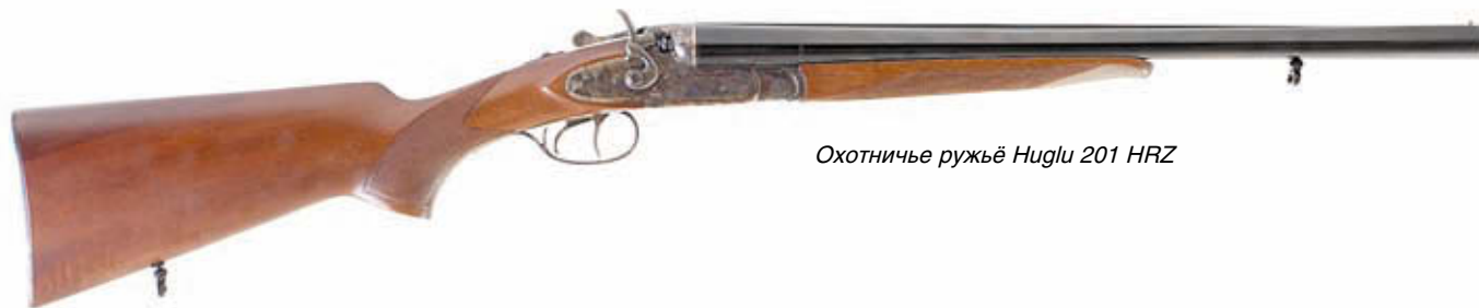
Охотничье ружьё Huglu 201 HRZ

Журнал «КАЛАШНИКОВ» уже писал о турецкой фирме Huglu (№ 6/2007, «Ружья Huglu – другая Турция»), которая среди всех турецких производителей оружия стоит особняком, выделяясь не только горным расположением, но и организацией производства (кооператив в совместной собственности всех работников), а также ассортиментом, где ключевая роль отведена не клонированным итальянским полуавтоматам, а классическим ружьям с вертикальным и горизонтальным расположением стволов.