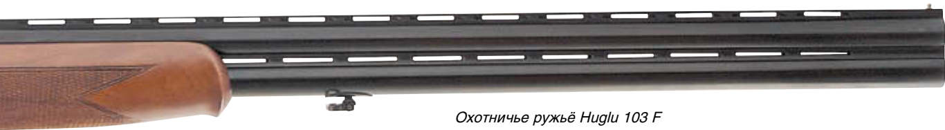
Охотничье ружьё Huglu 103 F