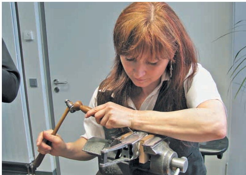
Мастерство гравёров – одна из сильнейших сторон «Меркеля»