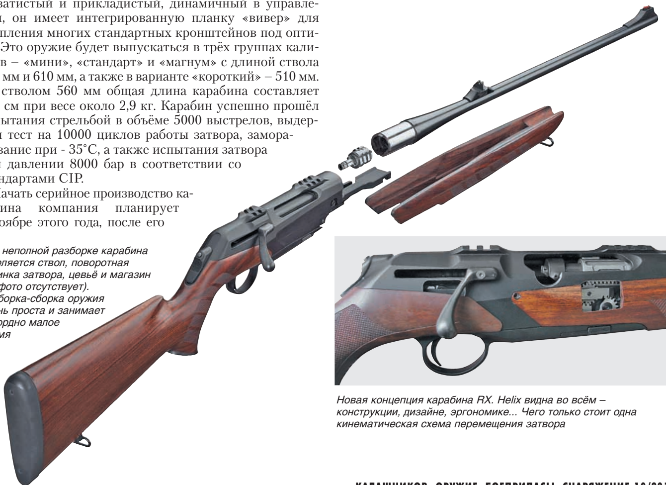
Новая концепция карабина RX. Helix видна во всём – конструкции, дизайне, эргономике... Чего только стоит одна кинематическая схема перемещения затвора