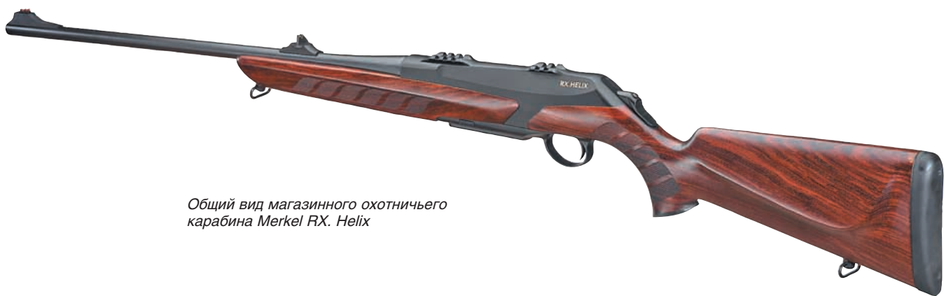
Общий вид магазинного охотничьего карабина Merkel RX. Helix

и механизмов, обеспечивая высокую безопасность, эргономичность и удобство в эксплуатации. О качестве боя речь не идёт вообще – немецкие карабины и винтовки уже давно являются эталоном качества и высоких баллистических характеристик. Не касаясь уровня исполнения – оно у «Меркеля» традиционно на высоте, карабин RX. Helix отличается быстрым циклом перезарядки, надёжностью запирания поворотной головкой затвора на ствол, бесшумно и плавно действующим механизмом ручного поджатия боевой пружины, высокими характеристиками спуска, наличием сменного (съёмного) магазина, очень коротким ходом рукоятки затвора, вдвое меньше хода самого затвора, возможностью смены ствола вместе с личинкой затвора без дополнительного инструмента. Карабин хорошо сбалансирован. Ухватистый и прикладистый, динамичный в управлении, он имеет интегрированную планку «вивер» для крепления многих стандартных кронштейнов под оптику. Это оружие будет выпускаться в трёх группах калибров – «мини», «стандарт» и «магнум» с длиной ствола 560 мм и 610 мм, а также в варианте «короткий» – 510 мм. Со стволом 560 мм общая длина карабина составляет 107 см при весе около 2,9 кг. Карабин успешно прошёл испытания стрельбой в объёме 5000 выстрелов, выдержал тест на 10000 циклов работы затвора, замораживание при - 35°С, а также испытания затвора при давлении 8000 бар в соответствии со стандартами СІР.