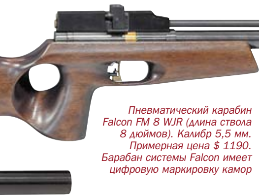
Пневматический карабин Falcon FM 8 WJR (длина ствола 8 дюймов). Калибр 5,5 мм. Примерная цена $ 1190. Барабан системы Falcon имеет цифровую маркировку камер