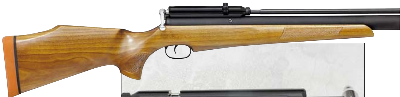
Пневматическая винтовка Logan Axor. Калибр 5,5 мм. Примерная цена $ 1216. Барабанный магазин этой одной из самых популярных РСР-винтовок вмещает 8 пуль

значительное число выстрелов, иногда измеряемое сотнями. Давление в баллоне может превышать 200 бар. Причём устройство некоторых моделей столь совершенно, что