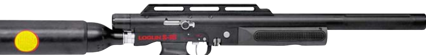
Пневматическая винтовка Logan S-16 с интегрированным модератором. Калибр 5,5 мм. Примерная цена $ 1300. 16-зарядный магазин винтовки Logan S-16 состоит из двух соединённых между собой 8-зарядных барабанов

Новая для отечественных любителей английская марка Falcon опять же появилась благодаря работе «Умарекса» по расширению модельного ряда.