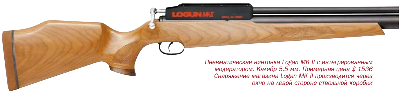
Пневматическая винтовка Logun MK II с интегрированным модератором. Калибр 5,5 мм. Примерная цена $ 1536 Снаряжение магазина Logun MK II производится через окно на левой стороне ствольной коробки

Необычная во всех отношениях 16-зарядная винтовка Logun S-16 (подробнее «КАЛАШНИКОВ» № 10/2003) полностью собирается в Великобритании.