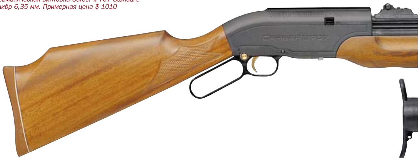
Пневматическая винтовка Career II 707 Standart. Калибр 6,35 мм. Примерная цена $ 1010

Первыми в нашей стране были сертифицированы винтовки английской фирмы NSP Engineering Ltd. (торговая марка Air Arms), которые к тому моменту уже имели некоторую популярность в узких кругах благодаря усилиям контрабандистов.