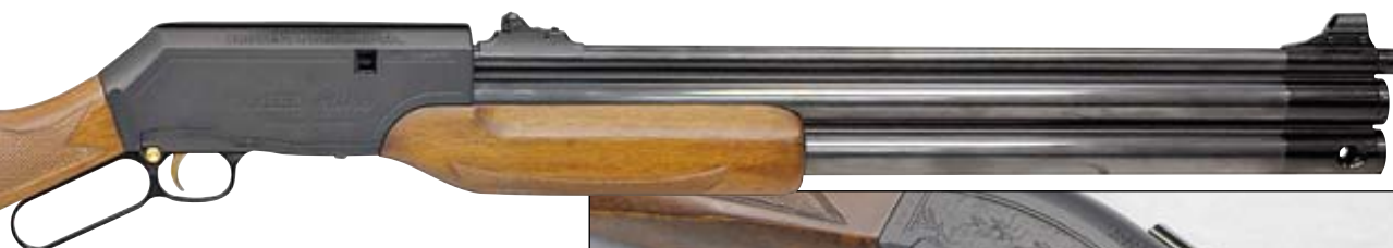
Пневматическая винтовка Career II 707 Ultra с модератором. Калибр 9 мм. Примерная цена $ 1110. Для перезарядки в модели Career 707 используется скоба Генри. Снизу ствольной коробки виден регулятор мощности

обеспечивает производство нескольких десятков выстрелов без заметной потери начальной скорости, что положительным образом сказывается на точности стрельбы.