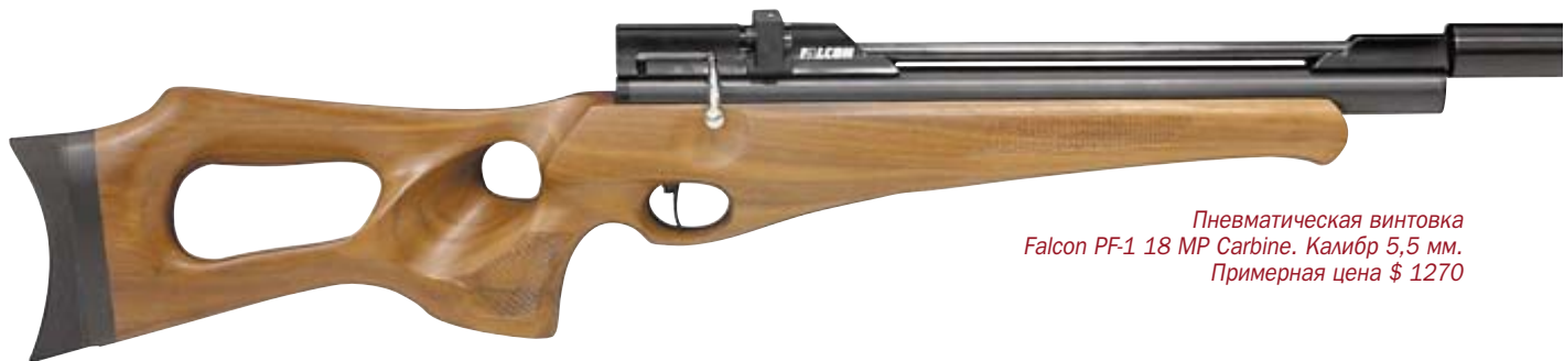
Пневматическая винтовка Falcon PF-1 18 MP Carbine. Калибр 5,5 мм. Примерная цена $ 1270