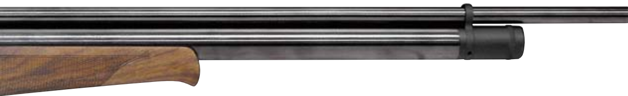
Пневматическая винтовка Air Arms S410 Long с интегрированным модератором, который внешне выглядит как кожух ствола. Калибр 5,5 мм. Примерная цена $ 1250