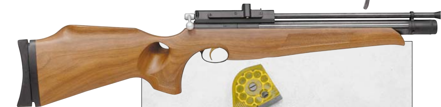
Пневматическая винтовка Air Arms S410 Carbine с присоединённым модератором. Калибр 5,5 мм. Примерная цена $ 1320 10-зарядный барабан винтовки Air Arms S410 заключён в своеобразный пластиковый кожух