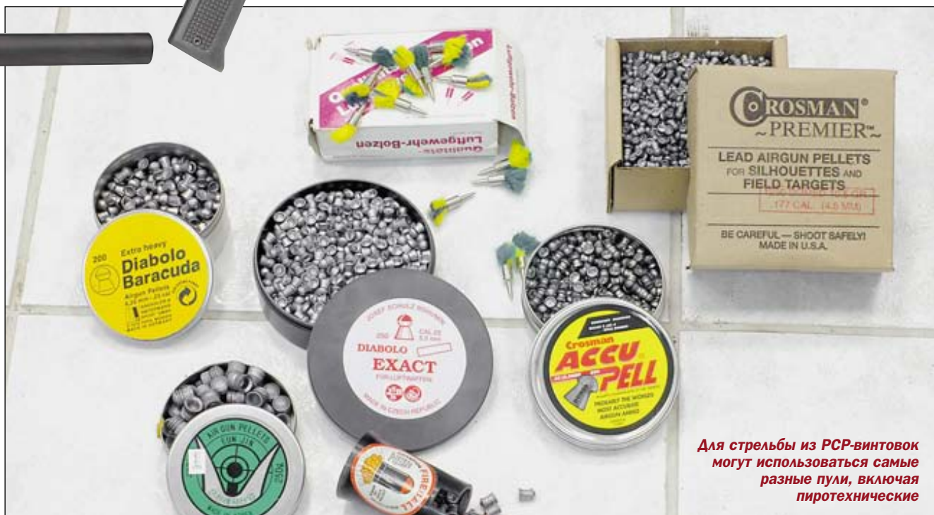
Для стрельбы из РСР-винтовок могут использоваться самые разные пули, включая пиротехнические