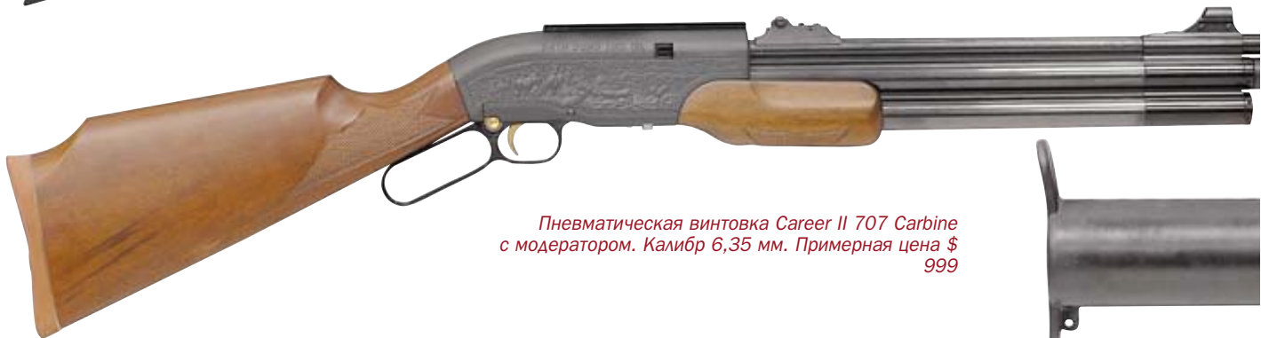
Пневматическая винтовка Career II 707 Carbine с модератором. Калибр 6,35 мм. Примерная цена $ 999