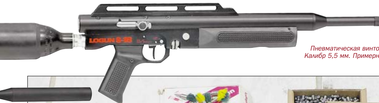
Пневматическая винтовка Logan S-16. Калибр 5,5 мм. Примерная цена $ 1290

Скорее всего, и в будущем году «Умарекс» не остановится на достигнутом, ещё больше расширив модельный ряд РСР-винтовок и подтвердив свою репутацию лидера российского рынка РСР-пневматики.