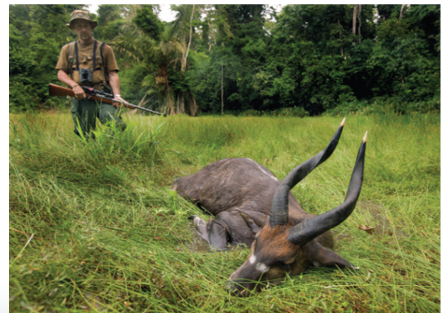
Зачастую ситатунгу добыть труднее, чем большинство винторогих антилоп.