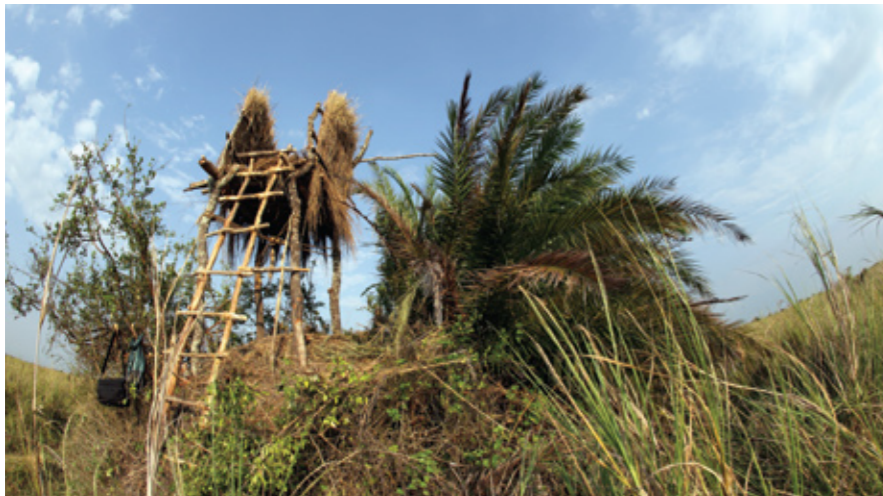
На ситатунг традиционно охотятся из засидки (называемой махан) с видом на болотистые места, где было замечено их появление.

может составлять всего полтора метра. Природа обладает своими инструментами адаптации, и практически всё, что живёт в лесу, маленькое – лесной слон минимум на треть меньше своего собрата, обитающего в саванне, а карликовый буйвол является самым маленьким из пяти видов буйволов, обитающих сегодня в Африке.