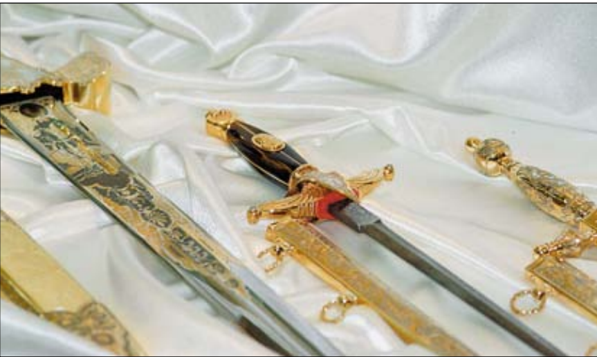
Украсили выставку клинки златоустовских мастеров. На фото изделия фирмы «АиР»

ет для чего, хищные вытянутые булатные клинки... Глядя на всё это, я испытывал смешанное чувство восхищения и сожаления. Восхищения нашими умельцами, не растерявшими в большинстве своём тех качеств, которые присущи настоящим профессионалам – желания творить,