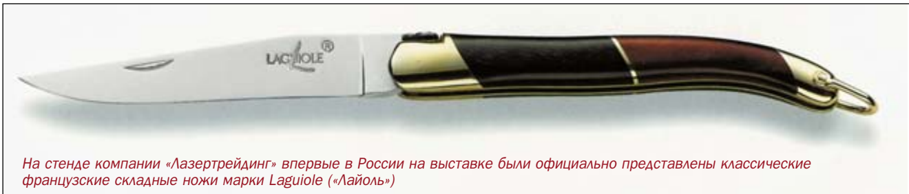
На стенде компании «Лазертрейдинг» впервые в России на выставке были официально представлены классические французские складные ножи марки Laguiole («Лайоль»)

ских и владимирских простых, но качественных клинков резали, рубили и строгали по всей территории Российской империи. В музеи же эти ножи никто целенаправленно не