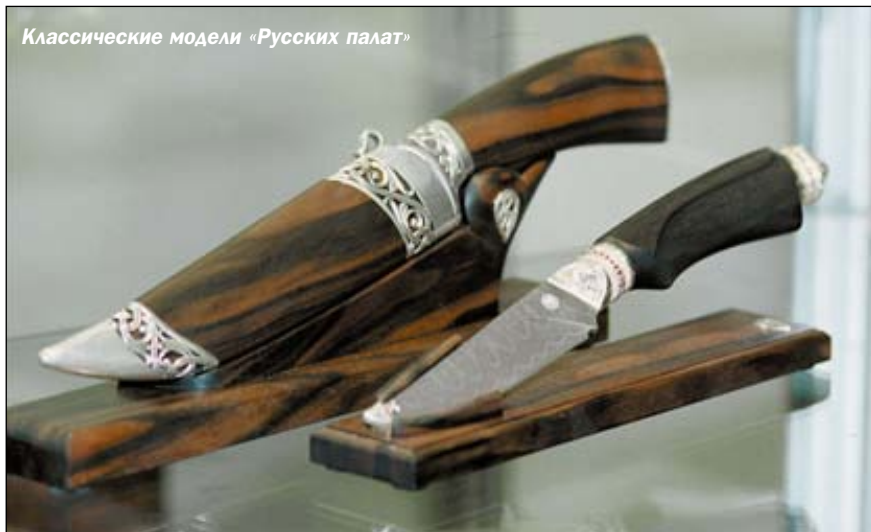
Классические модели «Русских палат»

Сейчас единственный российский музей, который готов формировать и уже формирует такие