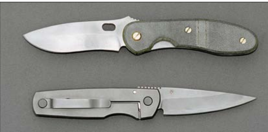
Среди прочих новинок «Шокуров» представил два уникальных складных ножа: один с рукояткой из титана, а накладки второго изготовлены из композитного материала на основе потёртой джинсовой ткани и прочного связующего вещества