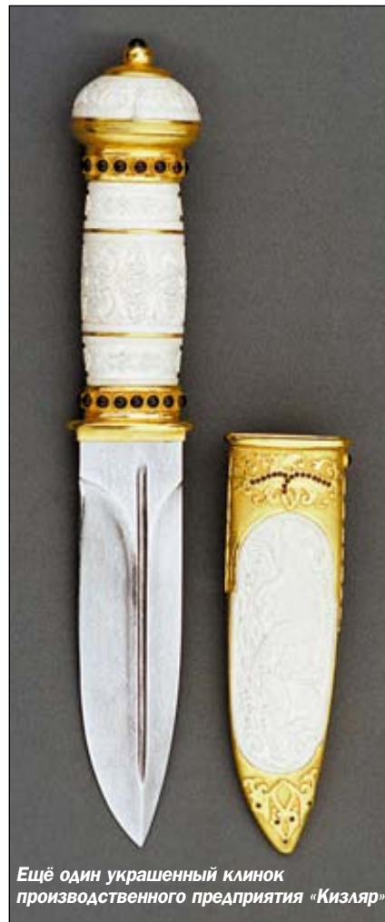
Ещё один украшенный клинок производственного предприятия «Кизляр»

Уверен, что подобных случаев можно было избежать, если бы перед выставкой осмотр антикварного оружия производил экспертный совет, члены которого никоим образом не должны быть зависимы от фирм-