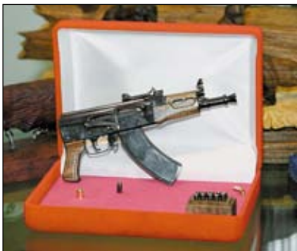
Журнал «КАЛАШНИКОВ» дождался – тульские мастера сделали стреляющую миниатюрную копию АКС74У

фирм, не меньше. В каких музеях хранятся их ножи 1997-1998 годов? Выжившие в условиях неотвратимого наступления рынка фирмы могли переименоваться, мастера продолжают работать, но кто и где хранит для всех и навсегда их продукцию именно тех совсем недавних лет?