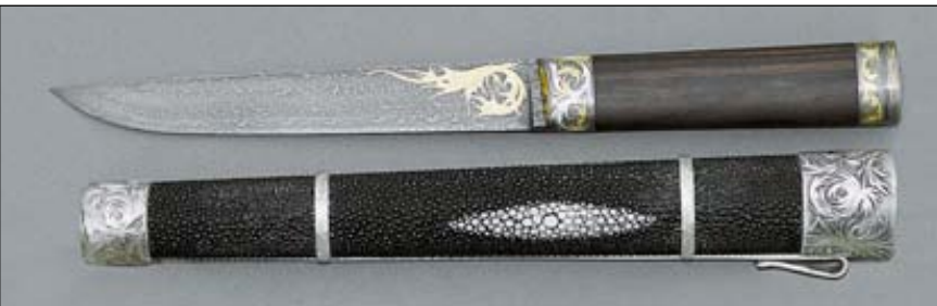
Ценителям булата и дамаска не нужно говорить из чьего металла изготовлены клинки этих ножей на стенде «Парка кузнецов»