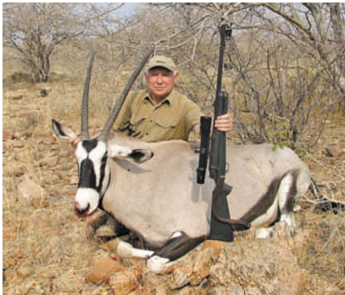
Автор статьи у своего «золотого» трофея – орикса