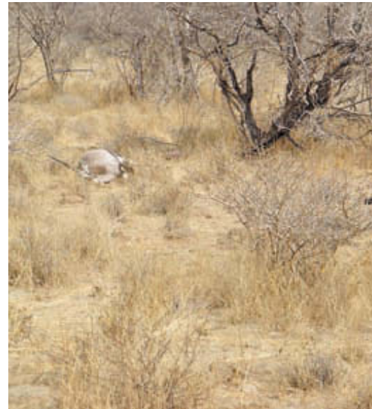
Первая минута после удачного выстрела...