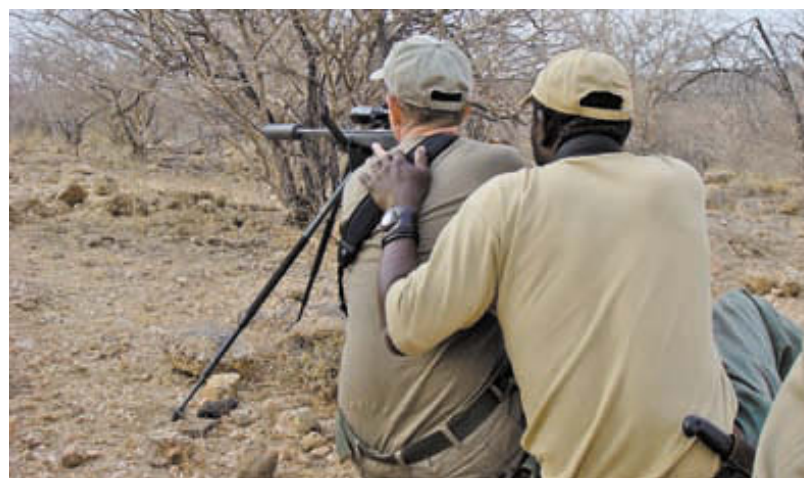
За мгновение до выстрела...