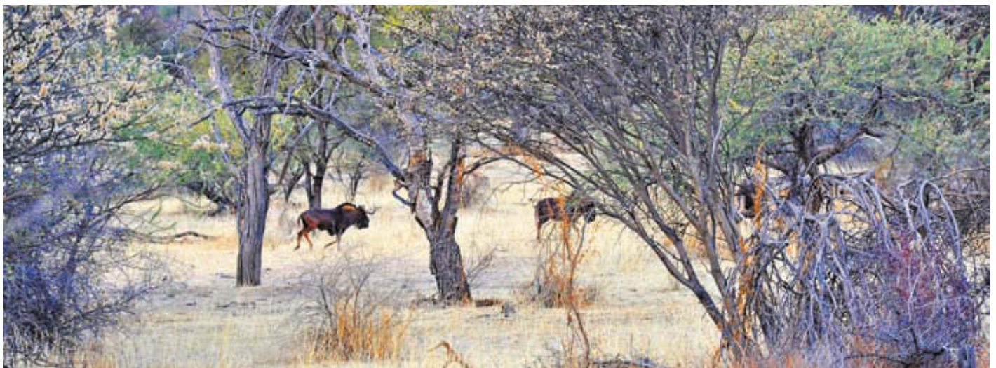
При поисках «голубых гну», как нарочно, нам везде встречались чёрные гну

Вечером того же памятного дня у нас произошло ещё одно впечатляющее событие – весь лагерь 7 River Lodge совершил выезд на знаменитую гору для проводов Солнца на закате и встречи Луны. По проложенной дорожке по склону горы мы на автомобилях забираемся на её вершину, где оказывается оборудованной открытая площадка для отдыха. С неё после неописуемо красочного заката солнца, по другую сторону от нашей «резервации», с помощью сильных биноклей Zeiss мы продолжаем наблюдение за простирающейся до горизонта саванной