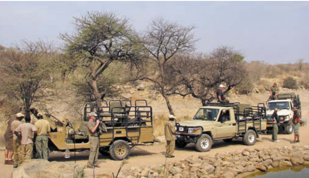
Сборы на охоту. На каждой машине размещалась одна группа охотников