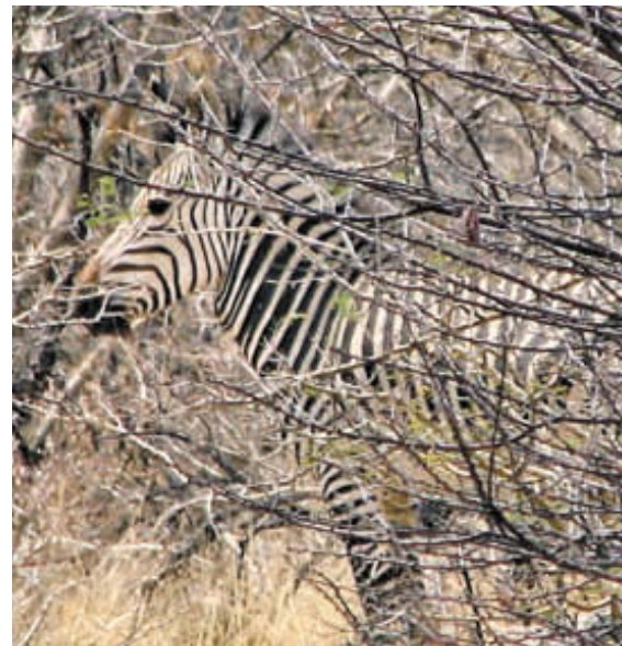
А вот зебры нам встречались не часто...