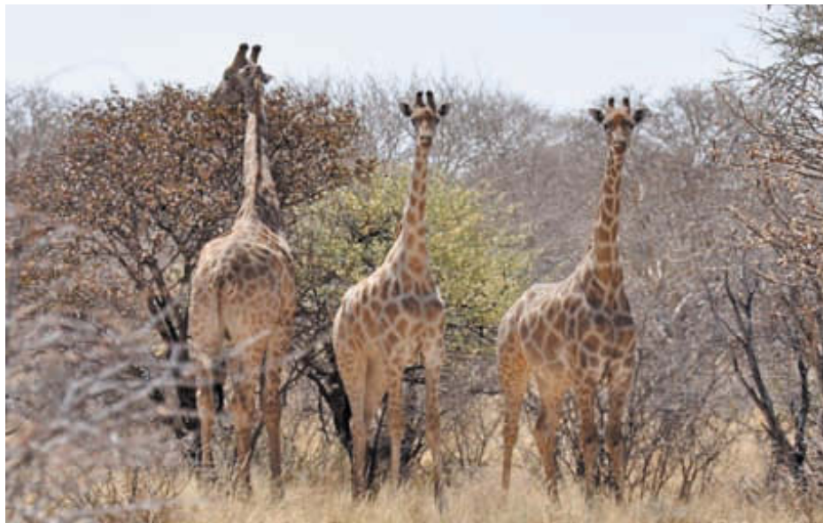
Следы, как и сами животные – впечатляют. Столь большие следы на песке оставляют грациозные пятиметровые животные – жирафы

Кстати, к месту здесь будет привести и несколько других подмеченных мной примеров «отвратительной» природы процессов и явлений окружающей нас действительности на охоте. Так, наиболее удобный для перехвата и вероятный лаз зверя чаще всего оказывается им уже покинутым; много шума и разговоров перед охотой – мало пользы и неудача на самой охоте; после занятия места в засидке направление ветра обязательно сменится на выгодное зверю и не выгодное охотнику; ни один вечерний план охоты не оказывается полностью выполненным на самой охоте; пуля от «шального», неприцельного выстрела часто попадает в совсем нежелательное место и т. д. и т. п.