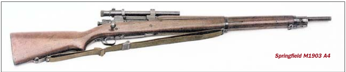
Springfield M1903 A4

1898 года, уступает «Арисаке» 1897 года по кучности стрельбы, имеет меньшую эффективную дальность стрельбы и убийную силу пули, чем винтовка Мосина 1891 года, а вместимость магазина у неё в два раза меньше чем у британской «Ли-Энфилд». Кроме того, всем магазинным винтовкам присущи такие недостатки как низкая скорострельность, а также большие габариты и масса. Но всё же Springfield M1903 во многом не уступает, а в чём-то и превосходит вышеперечисленные образцы, и занимает достойное место в истории магазинных винтовок. Об этом свидетельствует и та массовость, с которой выпускалась данная винтовка. Всего за период с 1903 по 1944 годы было выпущено 3,2 миллиона винтовок различных модификаций. Это, конечно, не наша «трёхлинейка», которая производилась в ещё больших количествах (12 миллионов штук), но согласитесь, цифра впечатляет.