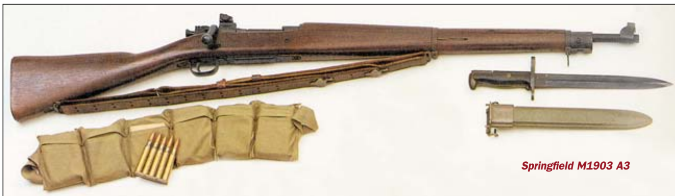
Springfield M1903 A3

того периода: «трёхлинейка» Мосина 1891 года, «Маузер» 1898 года, «Манлихер» 1895 года, «Арисака» 1897 года, «Ли Энфилд» Mk 4 1895 года. Все эти винтовки состояли на вооружении различных стран мира не один десяток лет, активно использовались во множестве войн и военных конфликтов, и доказали свою надёжность и высокие боевые качества, однако прогресс не стоит на месте, и все они уступили своё место автоматическому оружию.