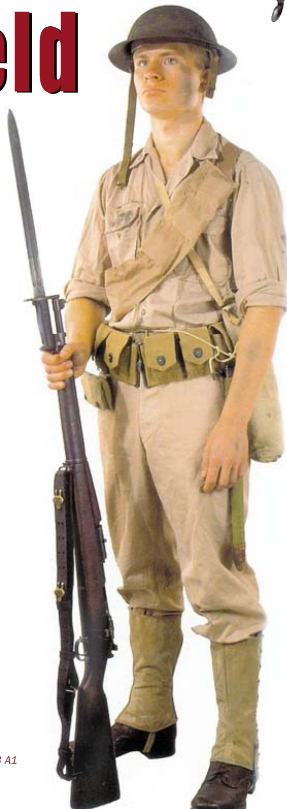
Springfield M1903 A1