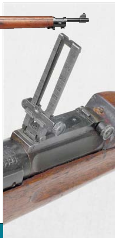
Целик винтовки Springfield M1903

Итак, конец XIX – начало XX веков. Пулемёты только начали поступать на вооружение ведущих стран мира, а на полях сражений господствуют магазинные винтовки. К слову, магазинная винтовка – это вершина эволюции неавтоматического оружия, и на этой вершине Springfield M1903 занимает достойное место в одном ряду с другими магазинными винтовками