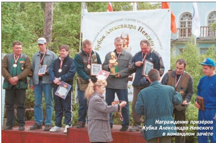
Награждение призёров Кубка Александра Невского в командном зачёте

манды организаторов турнира образовавшийся в первый день, москвичам удалось сберечь и во второй. Эта победа команды из Москвы заложила дополнительную интригу на будущий год, т. к. по положению о соревнованиях, команде победившей в них три раза подряд, кубок передаётся на вечное хранение. Журнал «Калашников» в свою очередь тоже выставил приз – набор