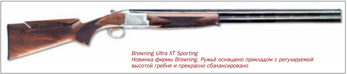
Browning Ultra XT Sporting Новинка фирмы Browning. Ружьё оснащено прикладом с регулируемой высотой гребня и прекрасно сбалансировано

оружие в «компакте» используется такое же, как в спортинге. Отличие состоит в том, что нет необходимости использовать стволы максимальной длины, так как дальность полёта мишени не превышает 40 м. Как правило, в компакт-спортинге используются ружья со стволами длиной 710–750 мм.