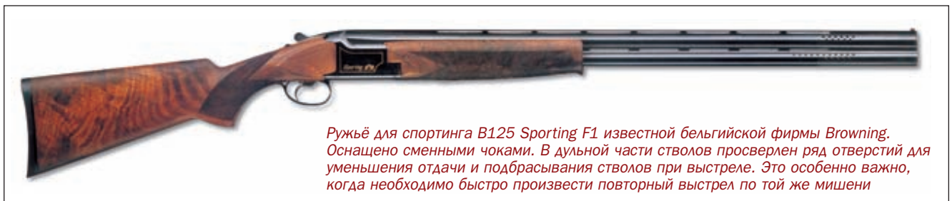
Ружьё для спортинга B125 Sporting F1 известной бельгийской фирмы Browning. Оснащено сменными чоками. В дульной части стволов просверлен ряд отверстий для уменьшения отдачи и подбрасывания стволов при выстреле. Это особенно важно, когда необходимо быстро произвести повторный выстрел по той же мишени

Полёты мишеней в этом упражнении также разнообразны, поэтому