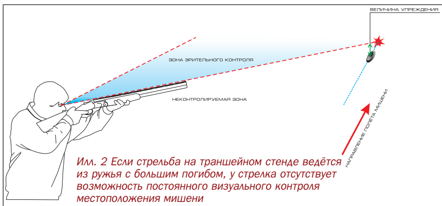
Илл. 2 Если стрельба на траншейном стенде ведётся из ружья с большим погибом, у стрелка отсутствует возможность постоянного визуального контроля местоположения мишени

При изготовке к выстрелу ружьё находится в плече. Стрелок прицеливается в зону вылета мишени ещё до момента её подачи. Стрельба ведётся на дистанции от 27–30 м до 45 м. На траншейном стенде применяются более тяжёлые ружья, центр