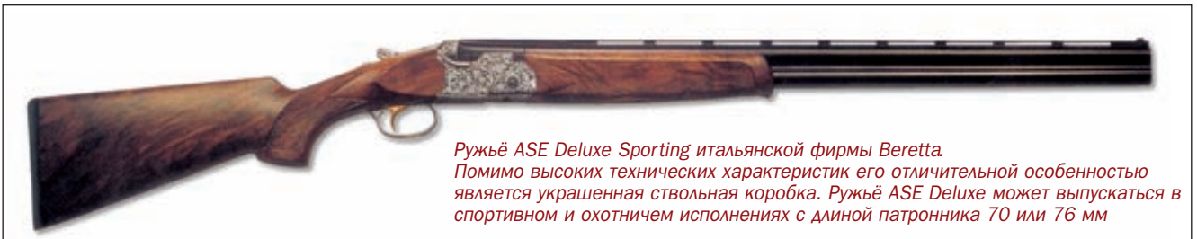
Ружьё ASE Deluxe Sporting итальянской фирмы Beretta Помимо высоких технических характеристик его отличительной особенностью является украшенная ствольная коробка. Ружьё ASE Deluxe может выпускаться в спортивном и охотничьем исполнениях с длиной патронника 70 или 76 мм