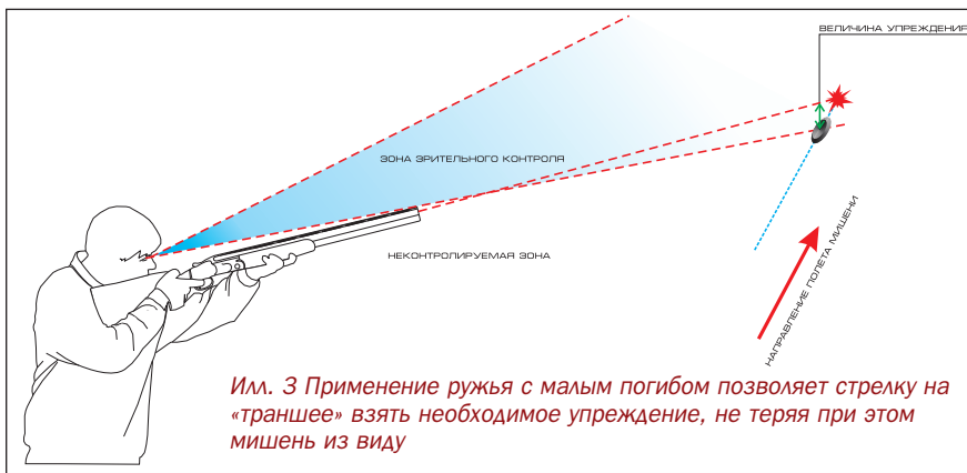
Илл. 3 Применение ружья с малым погибом позволяет стрелку на «траншее» взять необходимое упреждение, не теряя при этом мишень из виду

тяжести которых располагается ближе к дульному срезу. Это обеспечивает «плавное» стартовое движение и устойчивую траекторию ружья при прицеливании. Длина стволов 750–760 мм с сильными дульными сужениями (1–1,25 мм). Особенности траектории полёта мишеней предопределили особую геометрию траншейного ружья.