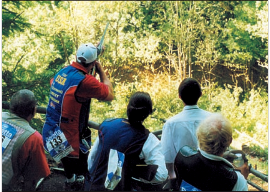
Стрелковые места в спортинге могут располагаться в самых неожиданных местах, что в сочетании с разнообразием возможных траекторий полёта мишеней делает этот вид спорта чрезвычайно зрелищным

В связи с большой популярностью и бурным развитием спортинга в России возник соответствующий спрос на оружие для этого вида спорта. К сожалению, отечественный производитель пока никак не отреагировал на сложившуюся ситуацию. Поэтому приходится ори-