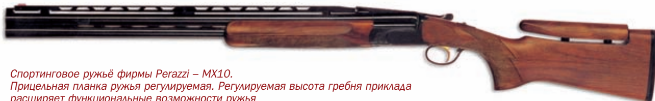
Спортивное ружьё фирмы Perazzi – МХ10.

Прицельная планка ружья регулируется. Регулируемая высота гребня приклада расширяет функциональные возможности ружья