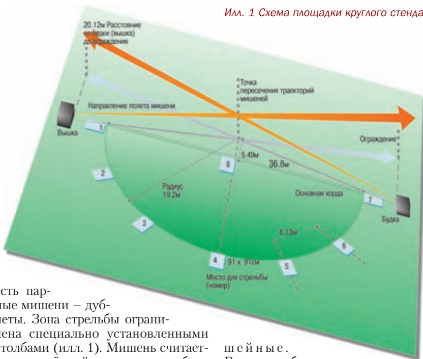
Илл. 1 Схема площадки круглого стенда

Ружья для круглого стенда имеют гораздо больший погиб, чем тран-