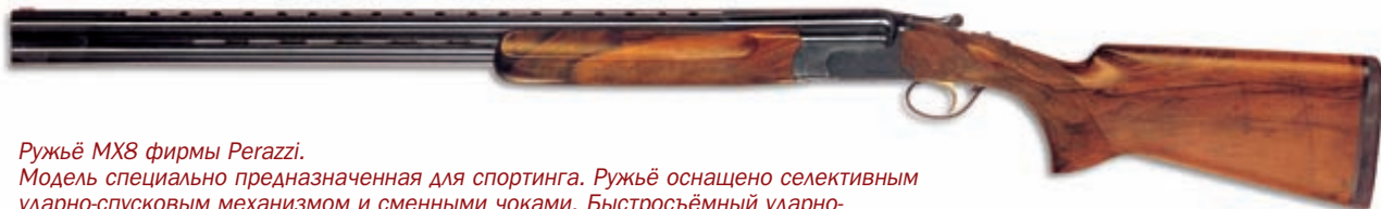
Ружьё МХ8 фирмы Perazzi.

Модель специально предназначенная для спортинга. Ружьё оснащено селективным ударно-спусковым механизмом и сменными чоками. Быстросъёмный ударно-спусковой механизм ружья смонтирован на отдельном основании и при поломке может быть оперативно заменён на исправный