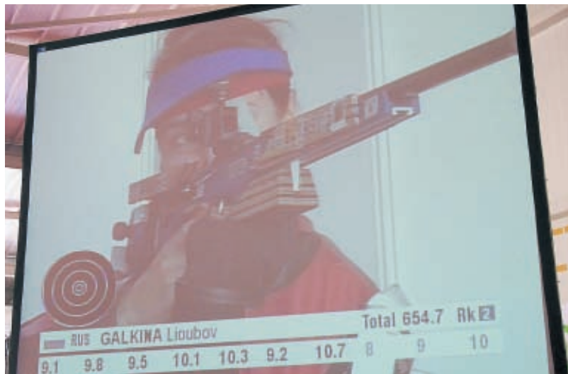
Восьмой выстрел финала в упражнении МВ-5. От титула чемпионки мира Любовь Галкину отделяет всего три выстрела