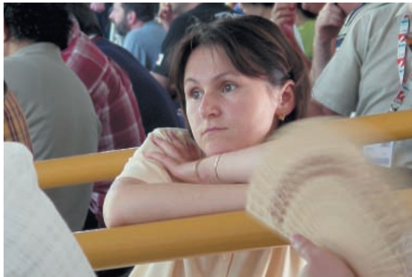
Чемпионка мира в стрельбе из пневматического пистолета Наталья Падерина