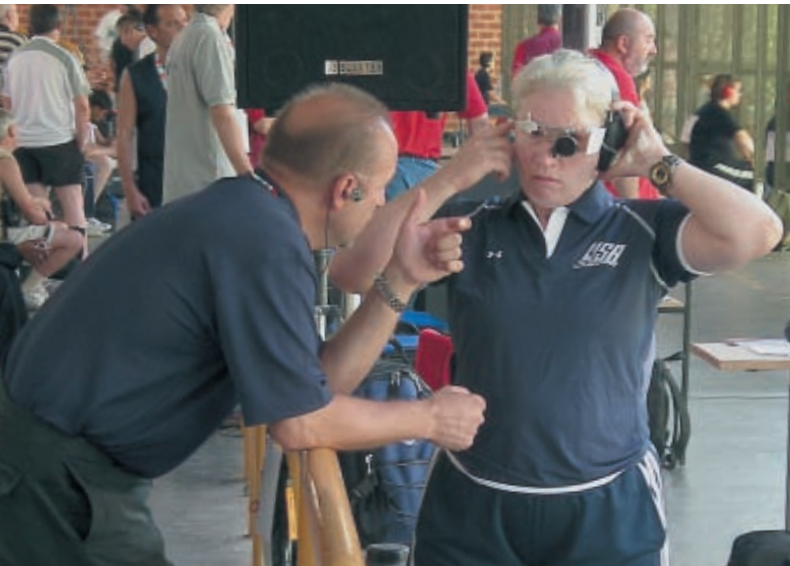
Экс-чемпион мира в упражнении «бегущий кабан» Сергей Лузов сегодня тренирует «пистолетную» команду США...

104,1 (чистыми 100) и перебравшись с пятого места на первое стала чемпионкой. Марина в итоге пятая.