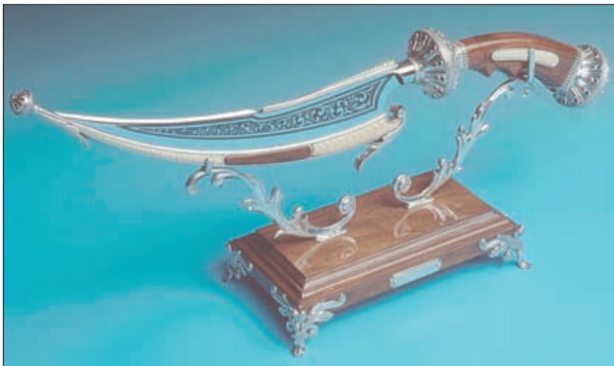
В интернациональной России всегда находились почитатели кавказского стиля. На выставке Кавказ представляли дагестанские мастера-оружейники из Кизляра и Кубачей

производим в России, так и отечественных фирмах-изготовителях.