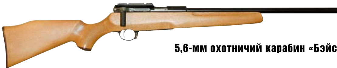
5,6-мм охотничий карабин «Бэйсик»

в паспорте данные, поскольку завод по экономическим соображениям использует для проверки далеко не самые лучшие патроны, и при этом надёжно укладывается в нормативы. А полностью реализовать возможности ствола удаётся далеко не каждому владельцу ввиду отсутствия высококачественных боеприпасов или стрелковых навыков, или того и другого вместе. Так что, если в паспорте SM-2KO приведён поперечник рассеивания 18 мм, не воспринимайте эту цифру буквально. Значение «18 мм» надо понимать, как «не хуже 18