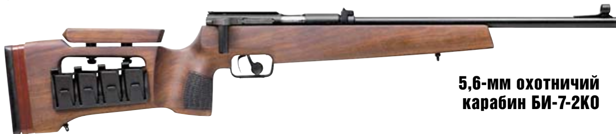
5,6-мм охотничий карабин БИ-7-2КО