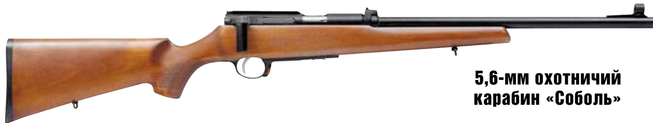
5,6-мм охотничий карабин «Соболь»