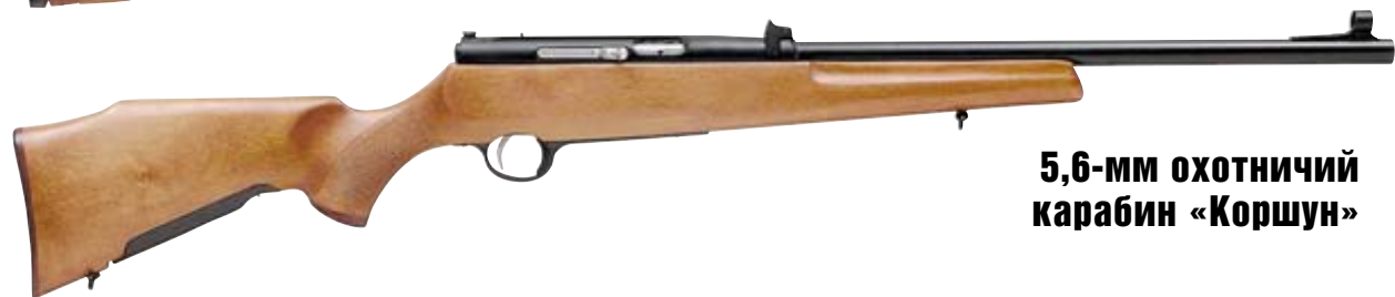
5,6-мм охотничий карабин «Коршун»

Н а самом деле идея статьи об СМ-2КО появилась в связи со страным положением, которое занимает эта модель на отечественном оружейном рынке. Магазиновые карабины ТОЗ-78 и «Соболь» известны каждому охотнику, тогда как обозначение «СМ-2КО» ставит в тупик даже некоторых знатоков оружия. Правда, стрелки-спортсмены, в данном случае, оказываются куда более эрудированными – им хорошо известна ижевская спортивная винтовка СМ-2. Как и в случае с «Соболем», который разработан на базе спортивной винтовки БИ-7-2, «гражданский» карабин СМ-2КО является прямым наследником известной спортивной винтовки. Отличия «охотника» от «спортсмена» очевидны: облегчённая ложа, укороченный ствол, упрощённые прицельные приспособления... В итоге доработки получился неплохой карабин, пригодный и для охоты, и для тренировочной стрельбы. По цене СМ-2КО занимает вполне справедливое промежуточное положение между ТОЗ-78 и «Соболем». Абсолютные цифры, в общем-то, приводить не имеет никакого смысла, так как, не единожды столкнувшись с парадоксальными