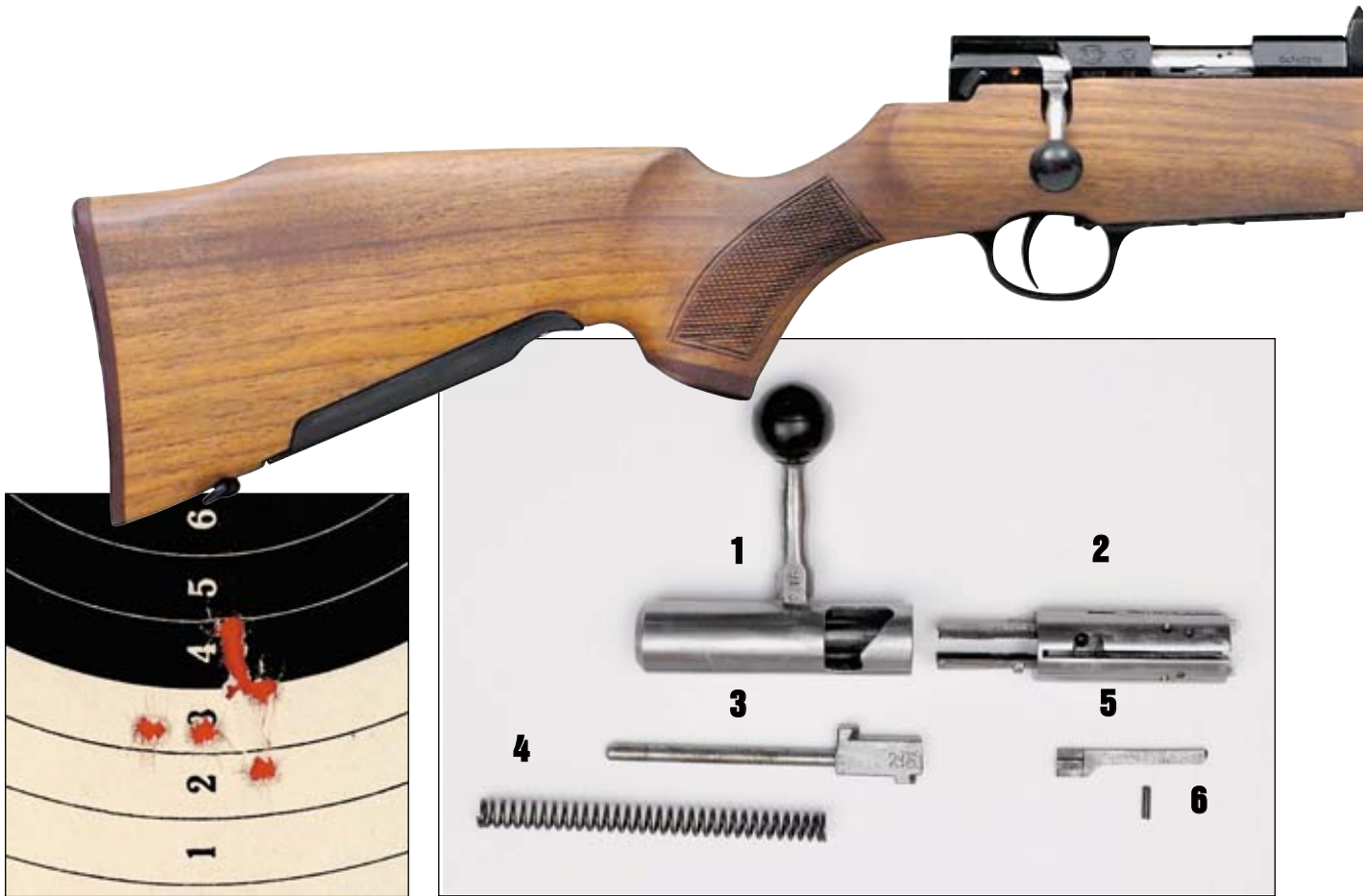
Результаты стрельбы из SM-2KO патронами 1978 года выпуска. Дистанция 50 метров, 7 выстрелов, точка прицеливания «под яблочко». М 1:1