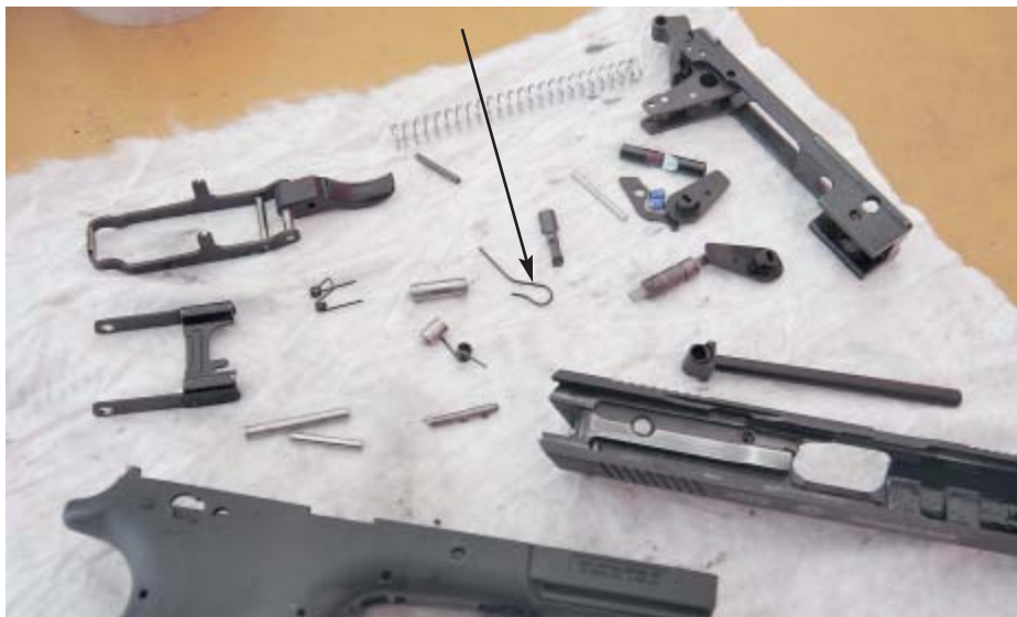
Результаты «разбирательства» К-100. Стрелкой указана злополучная пружинка затворной задержки, случайное извлечение которой послужило поводом для полной разборки пистолета

Возвращаясь к оружию, сразу скажу, что с К-100 у меня отношения не сложились. При стрельбе, слов нет, пистолет стоит на месте великолепно и обуславливается это, при относительной лёгкости оружия, скорее всего отсутствием вертикального перемещения ствола. Поворот