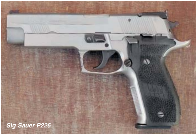
Sig Sauer P226