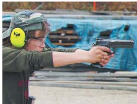
Возраст не мешает юному стрелку уверенно управляться с тяжёлым пистолетом (STI Edge)