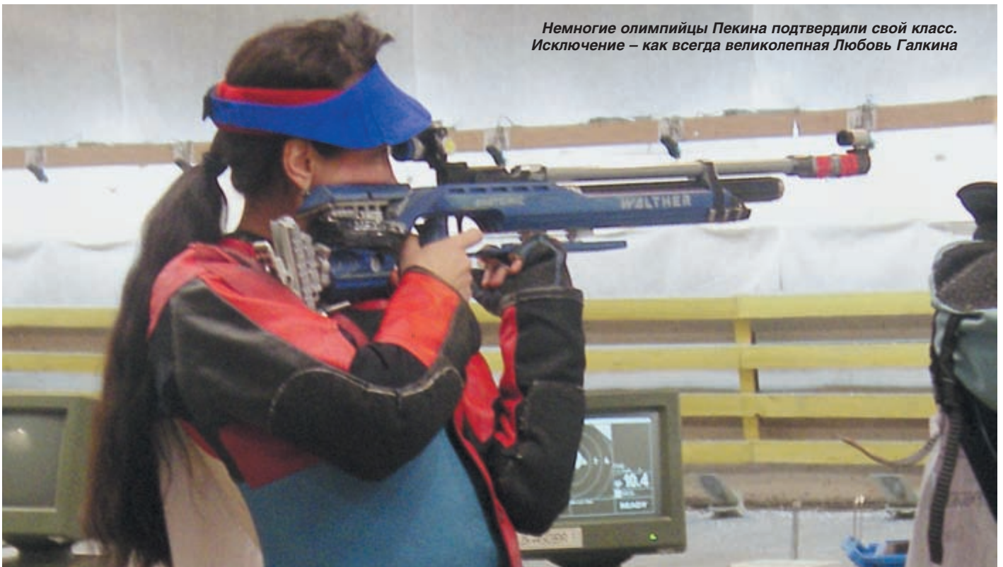
Немногие олимпийцы Пекина подтвердили свой класс. Исключение – как всегда великолепная Любовь Галкина