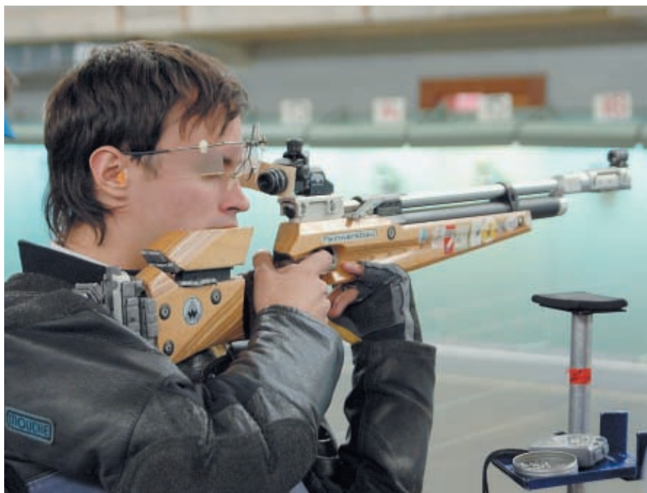
Победитель Кубка России 2006 Сергей Круглов