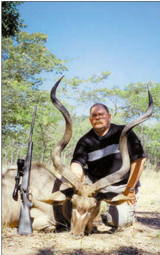
Куду – это просто песня. Ну, очень красивый трофей! Да и рога не подкачали – 55 дюймов

Зверя в буше достаточно, но и не так много, как в заповедниках, поэтому приходилось не один десяток километров проехать и не одну милю прошагать, чтобы добыть свой заветный трофей.