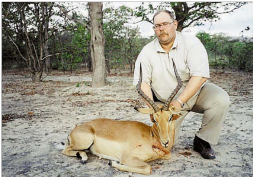
Антилопа импала. Стрелять можно только самцов. Пришлось немало потрудиться чтобы добыть эту быструю антилопу

По возвращении в Санкт-Петербург меня ожидало ещё одно радостное событие – по рекомендациям опытных охотников, в том числе и тех, кто помогал мне в этом сафари, я был принят в члены Safari club international (SCI).