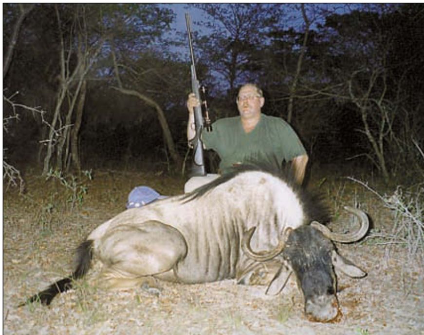
Антилопа гну. Очень запомнившийся трофей

В состав каждого экипажа на джипе входит белый профессиональный охотник (проводник), следопыт-тракер, наблюдатель от владельцев охотничьих угодий – гейм-скаут (проверяет законность добычи разрешённых к охоте животных) и один или два помощника из числа местного населения, работающего в охотничьем лагере.