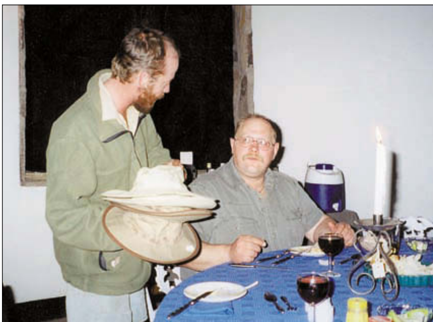
По итогам дня определялся лучший охотник, которому вручался памятный приз – охотничья шляпа с фирменным знаком

Теперь немного о быте. В распоряжение каждой пары были предоставлены отдельные бунгало с ванной и душем. Вода фильтруется и подогревается. Источник водо-