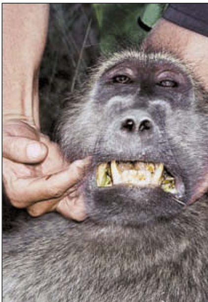
Бабуин – пугливое и в тоже время агрессивное животное, с огромными клыками

По возвращении в Санкт-Петербург меня ожидало ещё одно радостное событие – по рекомендациям опытных охотников, в том числе и тех, кто помогал мне в этом сафари, я был принят в члены Safari club international (SCI).